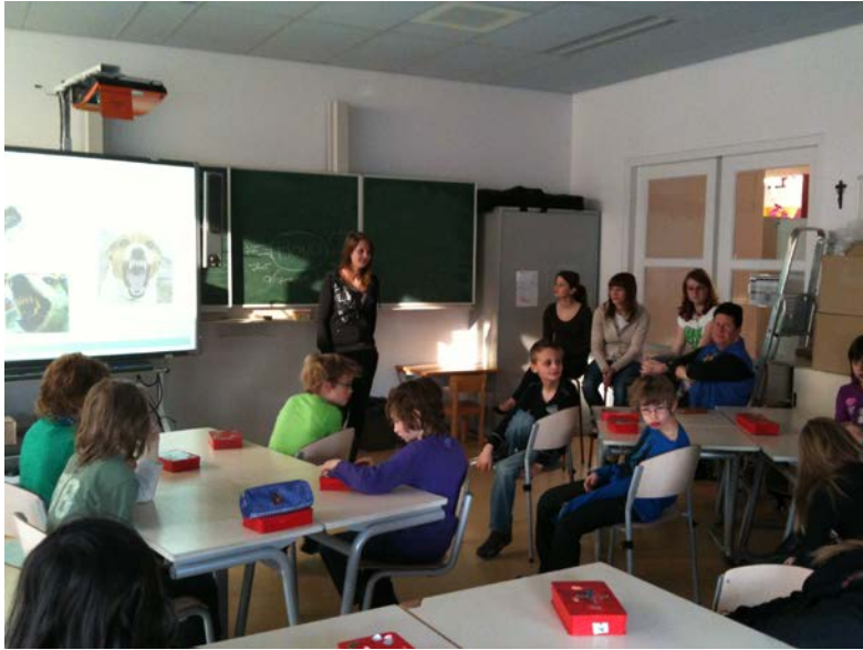
Tijdens uitleg van de 'juf'.