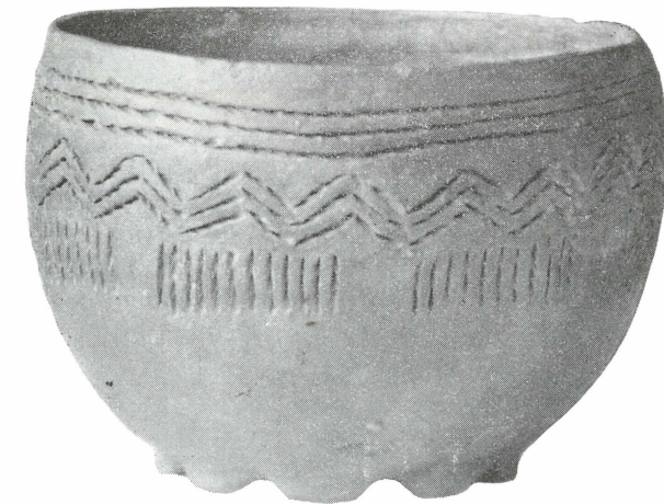
FIG. 2. Kom met diepsteekversiering uit Kisveld bij Neede (Gld.). 1: 2.

te Neede, thans te 's-Gravenhage. Deze stond de vondst in bruikleen af aan het Stedelijk Museum van Zutphen, Oudheidkamer van Zutphen en de Graafschap. Foto's van beide potten (door de firma H. Trijssenaar te Zutphen) waren in 1928 opgezonden naar het Biologisch-Archaeologisch Instituut van de Rijksuniversiteit te Groningen, met op de achterzijde enkele aantekeningen. Een schets van een der potten (naar de foto: fig. 2) werd — zonder vermelding van de vindplaats — afgebeeld op