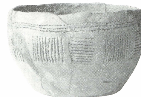
FIG. 3. Kom met diepsteekversiering uit Kisveld bij Neede (Gld.). 1: 2.

(b) Een kom (fig. 3), onder de rand versierd met resp. drie omlopende lijnen, en voorts,