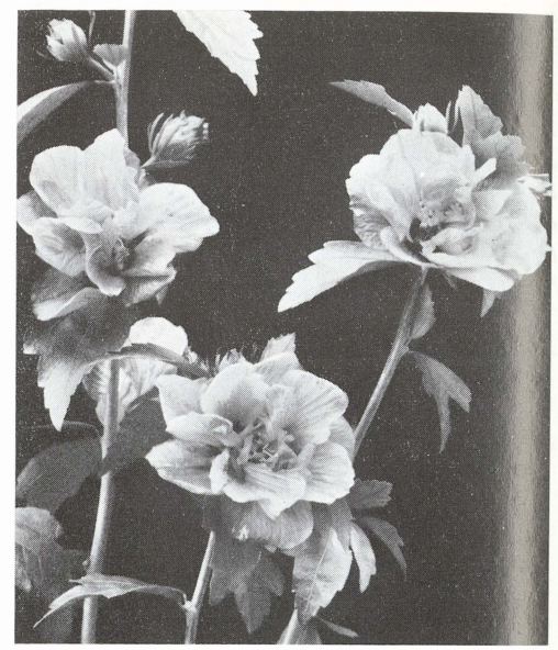
Hibiscus 'Puniceus Plenus'