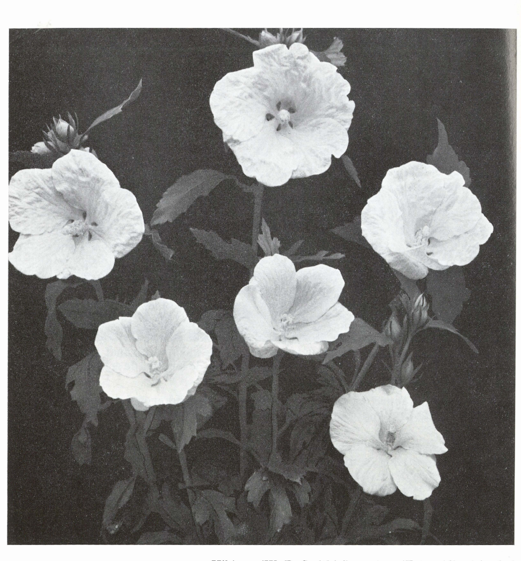
Hibiscus 'W. R. Smith' (boven) en 'Totus Albus' (onder)