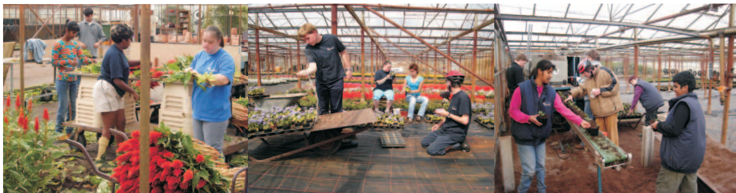
Op het glastuinbouwbedrijf van de familie Wijnen werken lichamelijk en verstandelijk gehandicapten samen met de eigenaren.