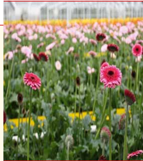
Audrey heeft haar intrede gedaan in de gerberawereld. Een donkerroze gerbera werd naar haar genoemd.

Peter: "We willen de markt niet verstoren met ons product. In een straal van 25 kilometer zitten er nog vier telers met ieder