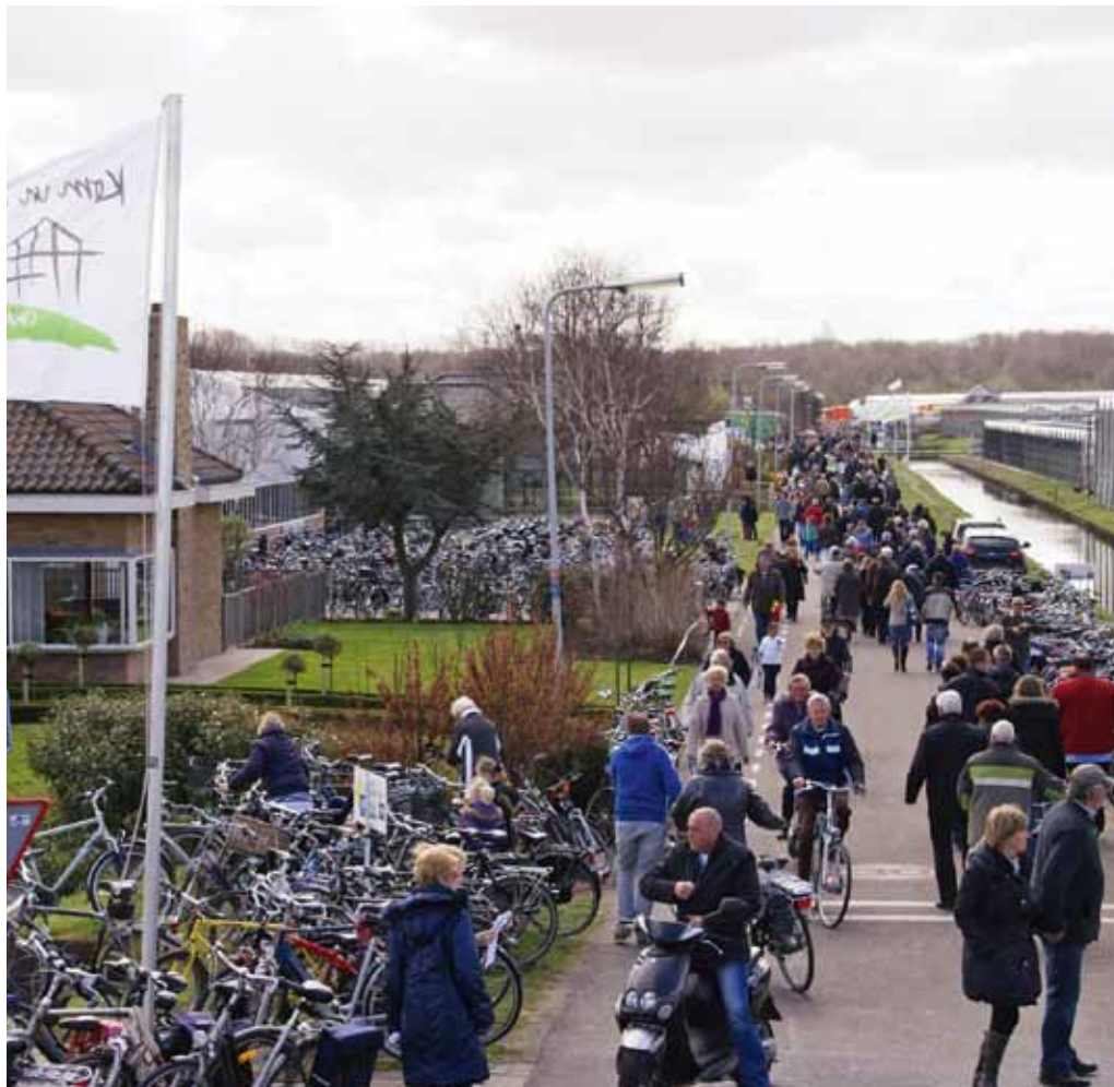
Jaarlijks trekt het evenement ongeveer 200.000 bezoekers.

dat de open dag nooit is ontaard in een commercieel evenement of misschien wel het aanstekelijke enthousiasme van de vele vrijwilligers.