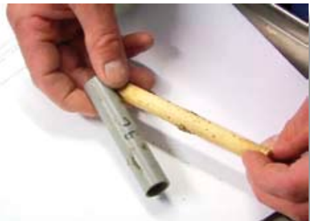
Instrument om de besmettingsdruk van bloedluizen te bepalen.

De veehouders bedachten dat ze een film konden maken om het ministerie van LNV en de sector voor te lichten. Met een infrarood camera gingen ze 's nachts de stallen in. Ook vroegen ze in de film om een tijdelijke