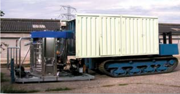
De door het netwerk ontwikkelde, mobiele melkrobot voor in de wei.