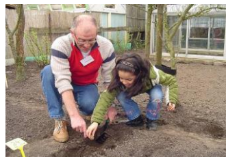
Tabel 1. Enkele voorbeelden van stadslandbouw

Als onderdeel van het programma Duurzaam Tilburg zijn zes projecten gestart waarbij kinderen zelf groente kweken in de stad. Sommige projecten zijn gelinkt aan een volkstuin. Een voorbeeld is de kindertuin van basisschool de Sleutel, die zich bevindt op volkstuin de Vlashof. Er zijn 51 tuintjes van elk twee bij twee en een halve meter. De school sluit bij het project aan met een lesprogramma en als dank voor de financiële bijdrage schenkt de volkstuin groenten aan de voedselbank ( www.duurzaamtburg.nl/De_h_eerlijke_Eetbare_Stad,138 ).