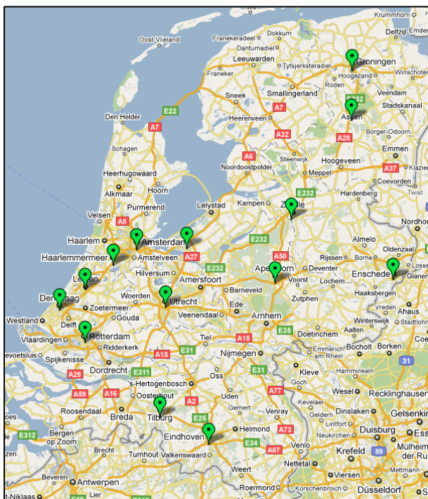
Figuur 1. De deelnemende steden aan het stedennetwerk

Zie voor de deelnemers aan het netwerk figuur 1 en bijlage 1.