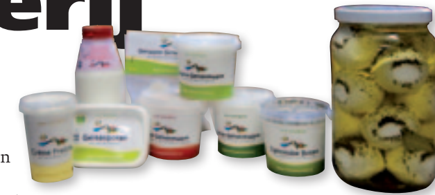
Op De Klompenhoeve wordt een breed assortiment geitenzuivel gemaakt.