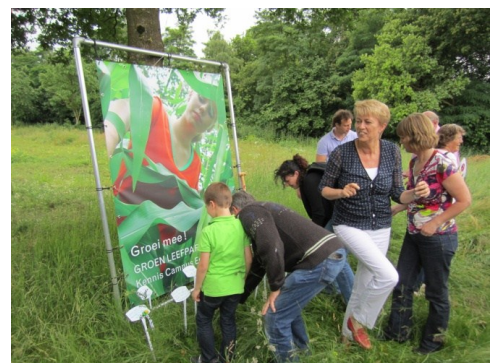
Alle aanwezigen konden hun ideeën voor het Groen Leefpark Ede kwijt op witte bordjes

groene leertuin voor alle leerlingen en studenten van de Kenniscampus'. De bordjes met 'voor elk wat groens/wils' en 'verbinding met alle groepen in het leefpark' benadrukten de gezamenlijke band tussen alle partners die de doorslag zal geven in de realisering van het Groen Leefpark de komende twee jaar midden in het hart van de Kenniscampus Ede.