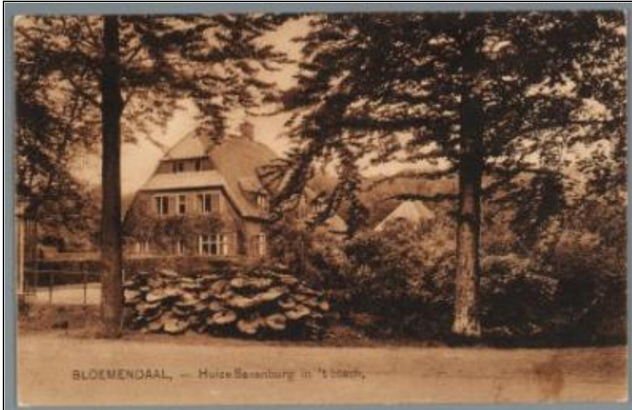
8. Villa Saxenburg gebouwd door J.W.Hanrath in 1919, met tuin naar ontwerp van D. F. Tersteeg. Beeldbank N-H.

1920 Saxenburger bos gekocht door gemeente.