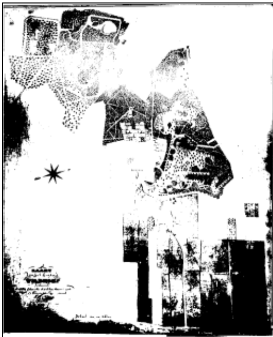
6a. Kaart van Wildhoef uit 1811 of later, door F. J. Nautz. Origineel zoek. Hele slechte foto in Rijksarchief N-H. Noorden rechts. Rechter deel op deze foto het oude Wildhoef; middendeel het Brakelse Bos; linker deel het oude Saxenburg. Detail van bovenste deel (huisplaats van Saxenburg) hieronder.

De oude huisplaats bleef daarna bijna 120 jaar lang onbebouwd, gedeeltelijk binnen de gracht gelegen, en onderdeel van het landgoed Wildhoef. In 1811 (of later, de datum is zeer moeilijk te lezen) werd het gehele landgoed opgemeten en in kaart gebracht door de landmeter F.J.Nautz (origineel onbekend; foto in RA Haarlem, Springer Aanwinsten).