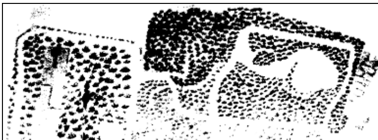
6. Detail van de kaart van Wildhoeve, door F. J. Nautz, 1811 of later. Het bos van Saxenburg ligt hier in het midden/boven, boven een golvende laan beplant met bomen. Het lijkt alsof er in het bos enkele paadjes naar een centrum van een heuveltje leiden.

In 1904 bracht de laatste erfgenaam, mej. C.A. van Wickevoort Crommelin al haar onroerende goederen, waaronder de gronden van Saxenburg, in bij de N.V. Maatschappij tot beheer en exploitatie van onroerende goederen "Veenduin", gevestigd te Amsterdam.