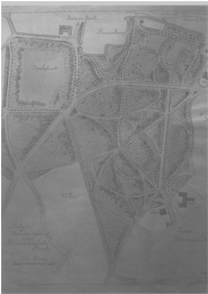
10. Ontwerp van L.A.Springer van Saxenburg en Bloendaalse Bos, 1920; Na de uitvoering van de verlenging van de Brederodelaan. Noordwesten boven. . Scan uit artikel Springer