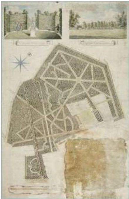
4. Kaart van het Brakelse Bos, met twee randprenten (Gezicht op Neptunusbeeld in het bos en Gezicht op de vinkenbaan in het bos). Noordwesten boven. Tussen 1757 en 1782.