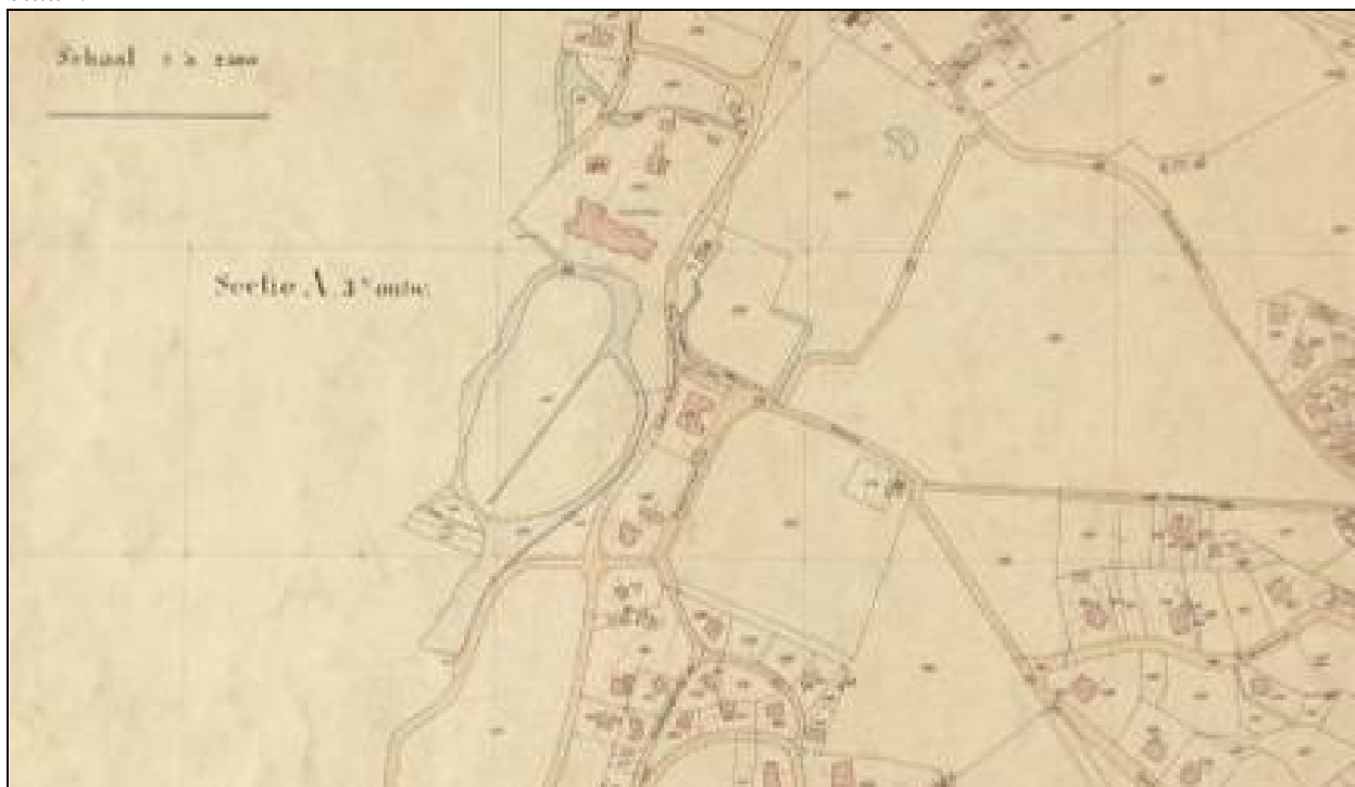
7. Kad. kaart Bloemendaal, detail Saxenburg, 1910. Sectie A. 2° blad. 1° ged. 3° ontw. Noorden boven. Prov. Atlas N-H.

Dit kenmerkende huis werd in 1990 geplaatst op de Provinciale Monumentenlijst en kwam in het kader van het MIP (Monumenten Inventarisatie Project) op de rijksmonumentenlijst te staan.