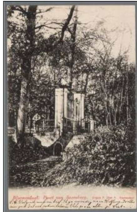
5. De toegangspoort met brug uit 1762.