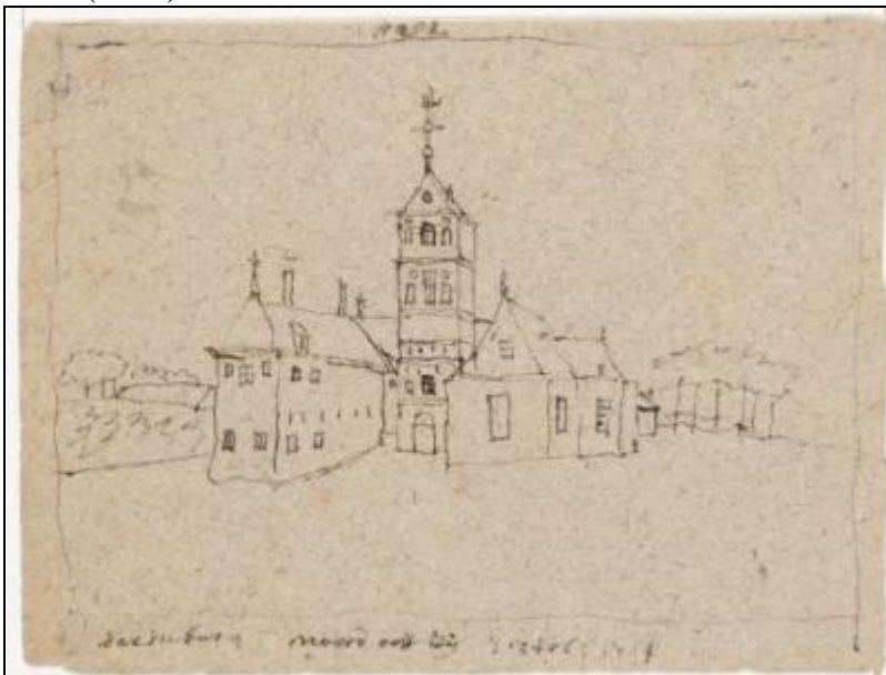
3. Tekening van Saxenburg aan de noordzijde, toegeschreven aan Hendrik Pola, 1718.

Ook kennen we dit huis van twee tekeningen, toegeschreven aan Hendrik Pola uit 1718 (Rijksarchief Haarlem, Saxenburg noord-oost-zijde, zie boven); van een pentekening van