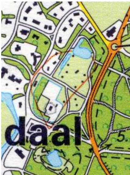
11. Topografische Kaart van Nederland 1:25.000; 25 A Haarlem, 2004. Deel Saxenburg en tegenoverliggende hertenkamp. Ten zuiden van Saxenburg ligt Thijsse's Hof (met vijver).