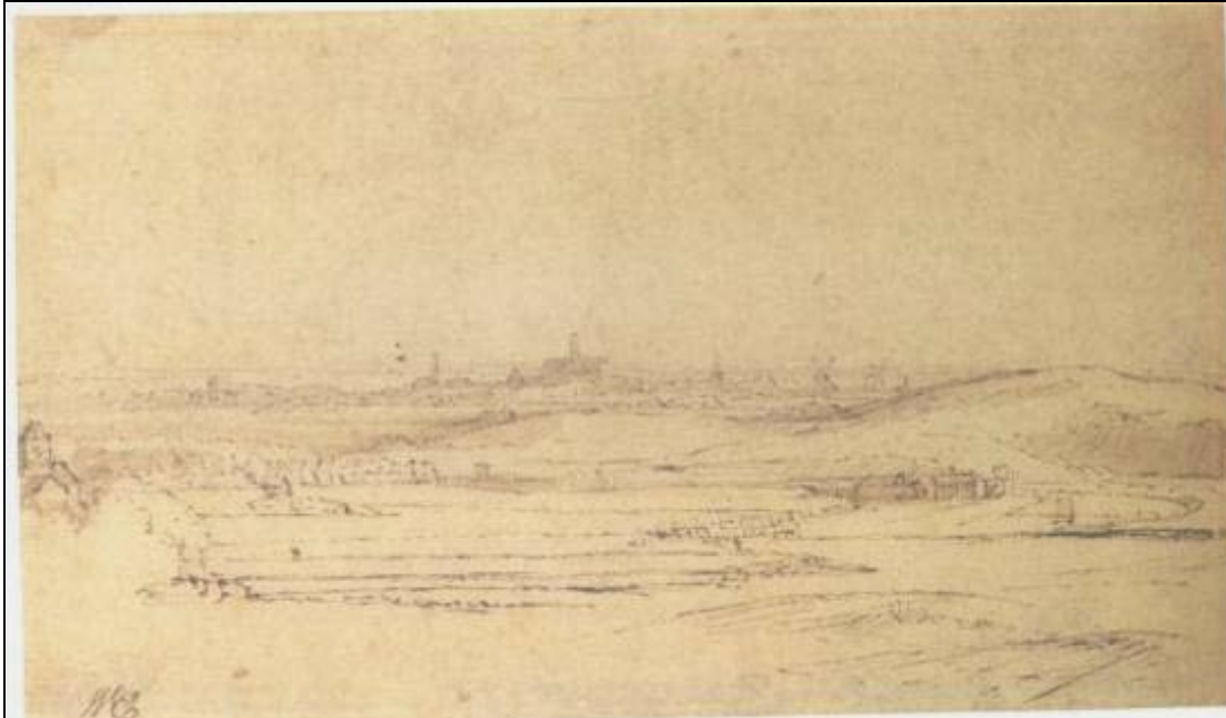
2. Tekening van Rembrandt van Rijn, 1651; Gezicht op Haarlem (in het midden de St. Bavo), met Huis Saxenburg links. Museum Boymans van Beuningen.

Eigenaar Thijs gaf aan dit buitenhuis te Bloemendaal dezelfde naam Saxenburg als zijn huis in Amsterdam, namelijk Saxenburg. Daarvoor heette het Cloeckendael of Cloeckenburg. Het Bloemendaalse huis is afgebeeld op een schilderij van Rembrandt (French en Co, New York); op een ets van Rembrandt (Rembrandthuis, Amsterdam; en National Gallery Washington) en op een tekening van Rembrandt (Museum Boymans van Beuningen, Rotterdam); alle afbeeldingen dateren uit 1651.