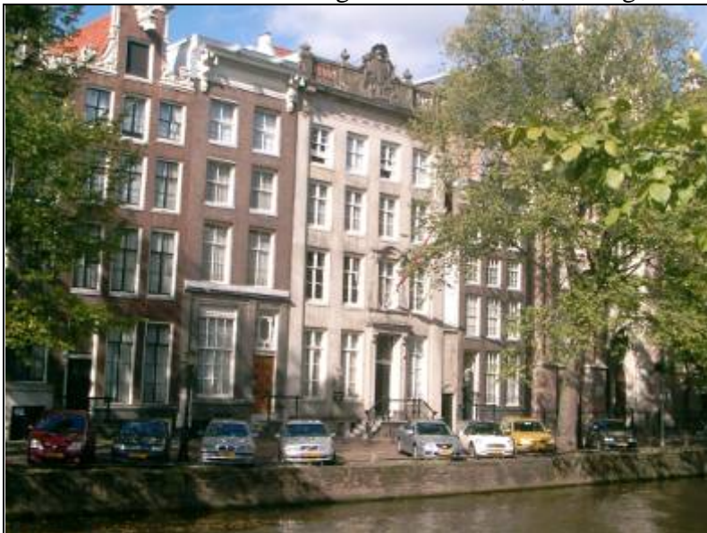
1. Huis Saxenburg, Keizersgracht 224, Amsterdam. Verbouwd in 1765.

Christoffel Thijs (hypotheekverschaffer van Rembrandt) kocht het huis omstreeks 1638. Hij woonde in het huis Saxenburg in Amsterdam, Keizersgracht 224.