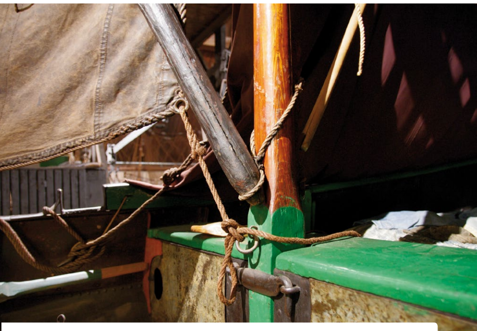
De mast en de spriet zijn op een heel eenvoudige manier, met een lus verbonden.