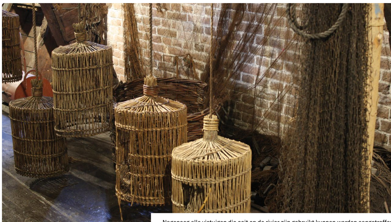
Nagenoeg alle vistuigen die ooit op de rivier zijn gebruikt kunnen worden aangetroffen.

Van Straten was er als bestuurslid net niet vanaf het eerste uur bij. "Ik ben nu 39 jaar bestuurslid. Net als bij de meeste andere 'Woerkumers' zit de visserij in mijn familie. In de veertiende eeuw kregen de inwoners visrechten van graaf Loef van Horne, de bouwer van Slot Loevestein. Hij gaf de Woerkumers het recht om te vissen in de wateren van Altena, 'vanaf de toren gezien zo ver het oog reikt.' Dan heb je het dus over een flink stuk van de Maas naar het zuidoosten en naar het westen een flink stuk van de Merwede. Later werden daar via ruil ook nog visrechten bij geregeld van de Heren van Arkel, bij Gorinchem. Dat recht werd gegeven aan 'poorters en poorterskinderen'. Dat waren de mensen die tenminste een jaar en zes weken binnen de vesting woonden. Het recht werd nadrukkelijk niet aan ➤