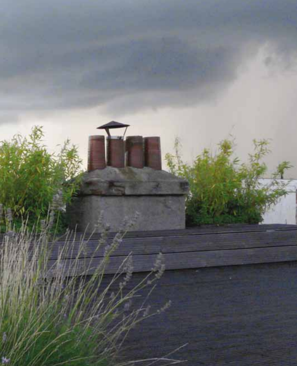
Een ontwerp van aayu architecten: plat dak van particuliere woning in Amsterdam Oud-West verbouwd tot volledige tuin met terras (80 m 2 ).

bij projecten buiten de stad kan dat grootschaliger (Kham school), en bij het concept voor het Eetbaar kantoor staat behalve het dak de gehele dubbele glasgevel vol met eetbare planten. Zelf houd ik bijen in Amsterdam. Ze doen het hier beter dan in een mono-agrarisch landschap.'