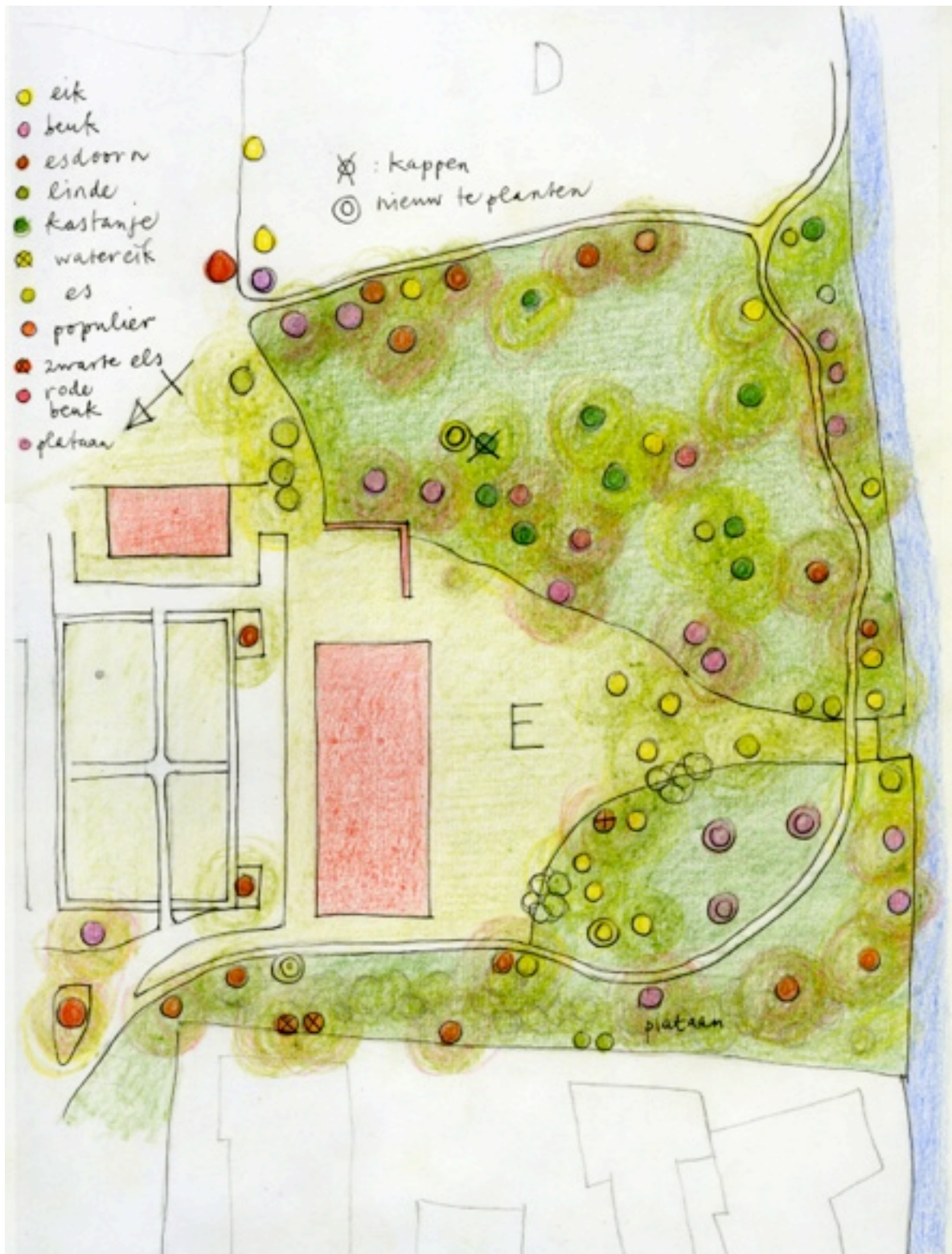
Vak E (tekening OHT)