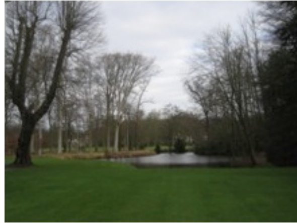
Links: Zuidelijke oever van de Zochervijver in het voorjaar; Rechts: Hulstboom in de as van de Zochervijver