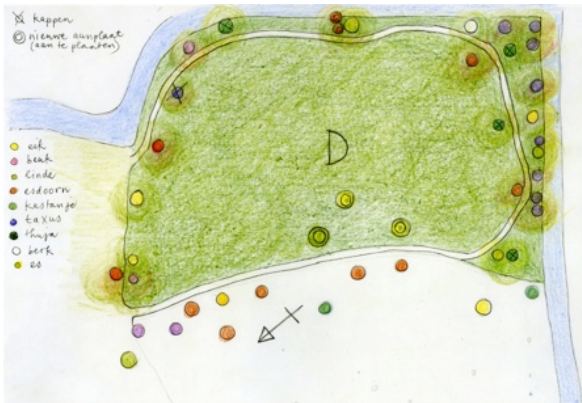
Vak D (tekening OHT)

* De open ruimte aan de zuidzijde van het pad tussen de vakken D en E beplanten met twee zomereiken (i.p.v. Prunus) en één es (zie kaartje). Hier opschot en kleine boompjes (< 20 cm. diameter) weghalen.