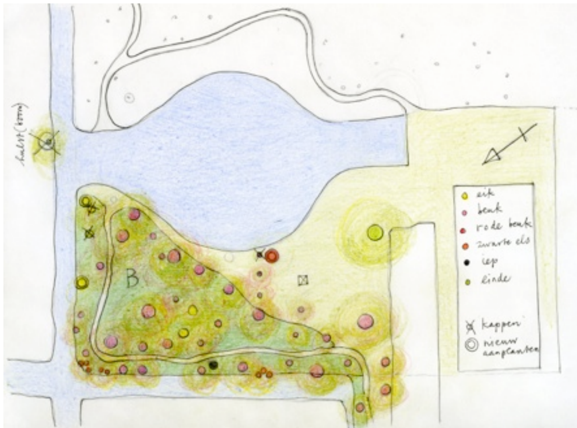
Vak B (tekening OHT)

* De jonge beuk zonder top vervangen door een rode beuk.