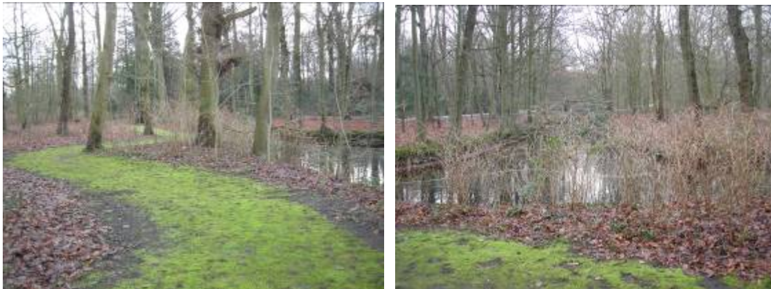
Links: Het slingerende pad langs westelijke watergang in vak E opschot-vrij maken en houden. Rechts: De Wenzelbrug is onzichtbaar door opschot en prachtframboos. De oevers langs de westelijke watergang afwisselend opschot-vrij houden.

De wal langs de gebouwen van de scholengemeenschap is afwisselend beplant maar mist nog enige variatie in heestersoorten en hoogopgaande bomen als afscherming tegen de scholengemeenschap.