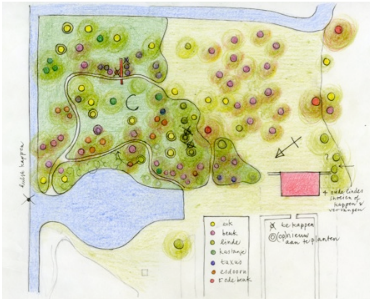
Vak C (tekening OHT)