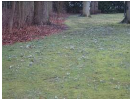
Links: prachtframboos verwijderen. Rechts: Sneeuwkllokjes (nog niet helemaal uit). Voorzichtig omgaan met de stinsenplanten