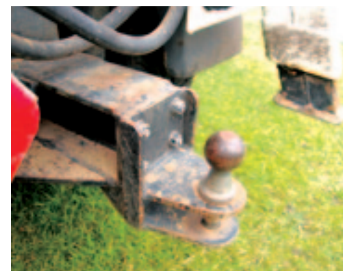
De Tremo mag 3.500 kg trekken, een kleine mini-graver op een trailer bijvoorbeeld.