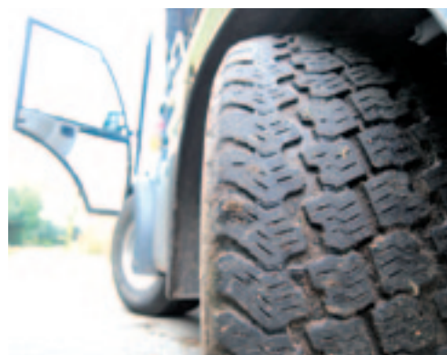
Optioneel heeft de Multicar Tremo Carrier vierwielbesturing.