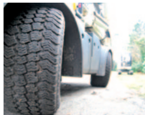
Met vierwielbesturing kun je de achteras vastzetten in elk stand en kun je in hondengang rijden.