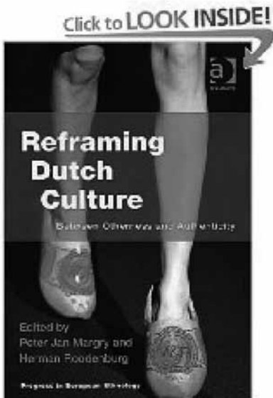
Afbeelding 2. Reframing Dutch Culture

Cultuurbewonderaars en cultuurbeoefenaars (2009) 4 : “Sinds het midden van de jaren negentig is de publieke belangstelling voor cultureel erfgoed gestegen. Met deze belangstelling behoort Nederland tot de koplopers in Europa. Het museumbezoek onder de Nederlandse bevolking groeide van 35% in 1995 naar 41% in 2007. Die groei geldt voor alle typen musea, met uitzondering van volkenkundige musea. In dezelfde periode nam ook het percentage bezoekers van monumenten toe van 43% tot 45% en ook archieven trokken meer publiek: 2,9% in 1995 en 4,3% in 2007. Sinds 2003 is het museum- en archief bezoek wel gestegen, maar de belangstelling voor monumenten niet.”