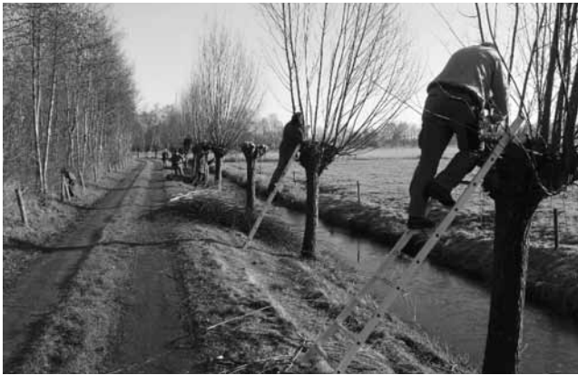
Afbeelding 4. Actief beheer van erfgoed door burgers

Veel rustiger is de verschijningsvorm van actieve amateurstudie, heemkundekringen, en van actief beheer door individuele burgers (afbeelding 4) denk aan landgoedeigenaren of collectieven van burgers, denk ook aan weidevogelbeheer collectieven of verenigingen van landschapsbeheer. Dit is een veelvormig en bont gezelschap met soms een heel smalle en gerichte interesse, denkt u aan de metaaldetector amateur archeologen, en soms een heel brede bestuurlijke en maatschappelijke interesse zoals een Verenigingen Kleine Dorpen in Noord Nederland.