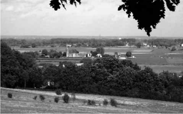
..... Afbeelding 5. De Ooypolder, gezien vanaf de stuwwal.