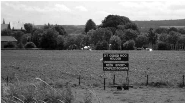
..... Afbeelding 3. Burgerverzet bij ruimtelijke ingrepen kan bijdragen aan ruimtelijke identiteitsvorming

Denk aan een beweging als Landroof , die het protest tegen nieuwe vormen van ruimtegebruik razendsnel organiseert via het Internet. In andere situaties is sprake van een jarenlang volgehouden verzet vaak via Stichtingen en Verenigingen, denk bijvoorbeeld aan de Vereniging Midden Delfland die aanvankelijk ontstond als verzet tegen de stedelijke bebossing, vuilstort en Rijksweg 19. In de retoriek van de verzetsdiscoursen wordt het erfgoed van het authentieke landschap en de dreigende teloorgang van de identiteit van de regio gebruikt ter onderbouwing en legitimatie.