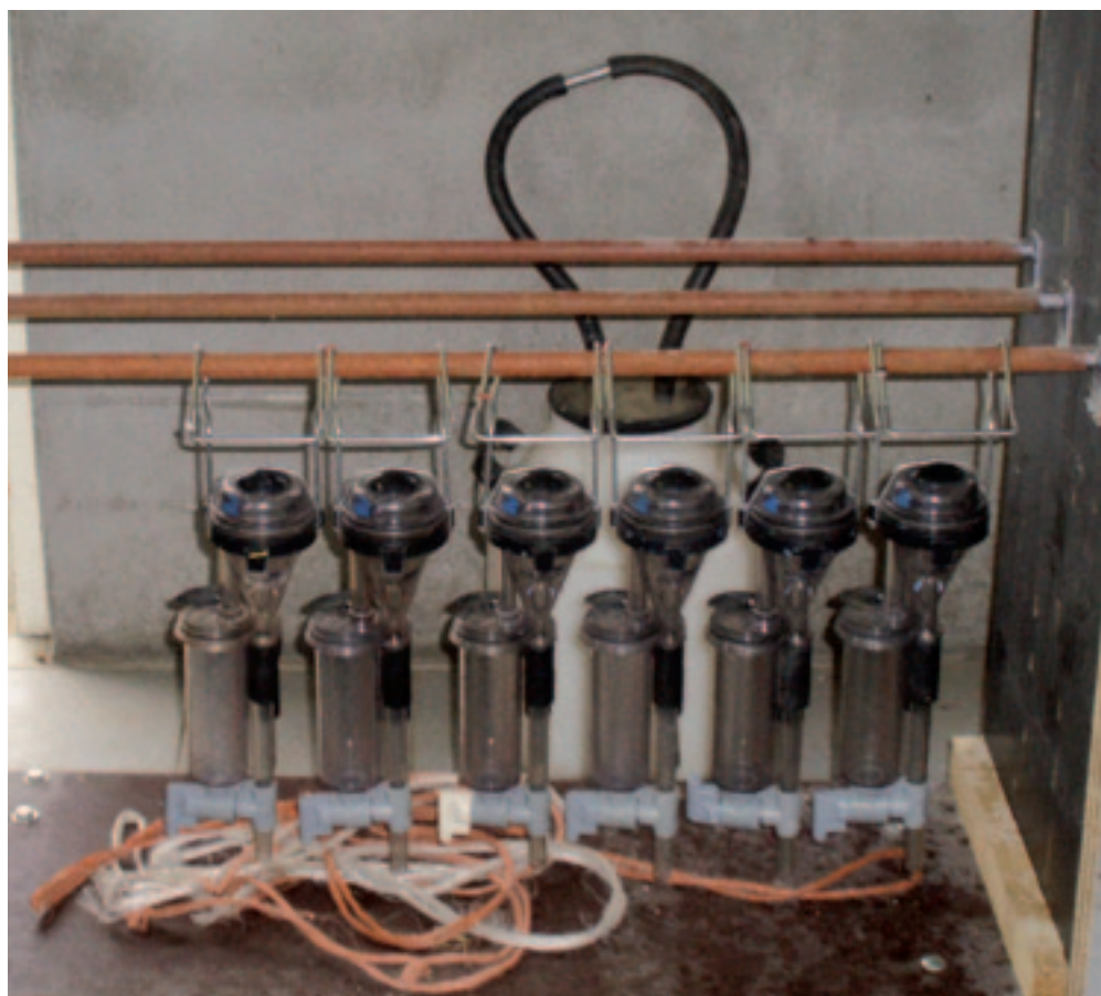
De apparatuur voor de melkcontrole staat klaar.

weken alle dieren, maar alleen van de jaarlingen worden de gehalten bepaald. Christian: "Van de overige dieren worden uitsluitend de liters geregistreerd." Ze halen veel voldoening uit de melkcontrole. Daarnaast is de productie in de afgelopen tien jaar gestegen van 850 kg