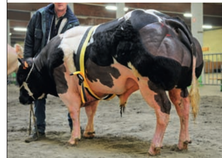
Gueze van de Kerkenhofstede (v. Adajio), kampioen middencategorie stieren