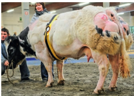
Escargot v.d Mespelhoeve (v. Germinal), kampioene gekalfde vaarzen en koeien

van Terbeck en Hannah Montana van het Hof te Landegem (v. Langoureux) van NV De Brandt uit Oordegem langs zij. Maar de jury kwam eensluidend uit bij Hartje. De jury was overigens niet altijd unaniem in Affligem. Zo zorgde de laatste reeks voor flink wat discussie tussen Vlaamse fokkers en Waalse juryleden. Ligt het fokdoel in beider landsdelen dan zo ver uiteen? Men kon het zich afvragen in de koeienreeks, waar de fijne, compact gebouwde, maar uiterst sterk bevelesde Escargot van de Mespelhoeve de