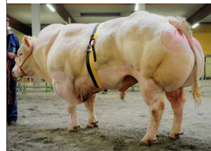
Sobriquet de Somme (v. Ogival), kampioen oudere stieren