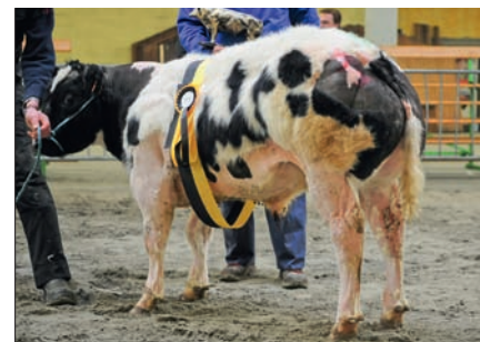
Herve van Moorsel (v. Argan), kampioen stierkalveren