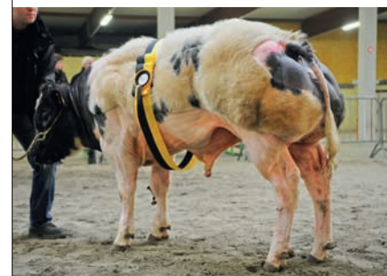
Praga-Khan van de Bremberg (v. Adajio), kampioen jonge stieren