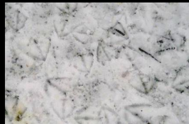
Kinderen fotograferen diersporen