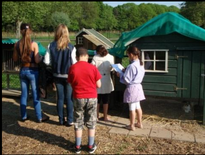
Wat doet de kip?