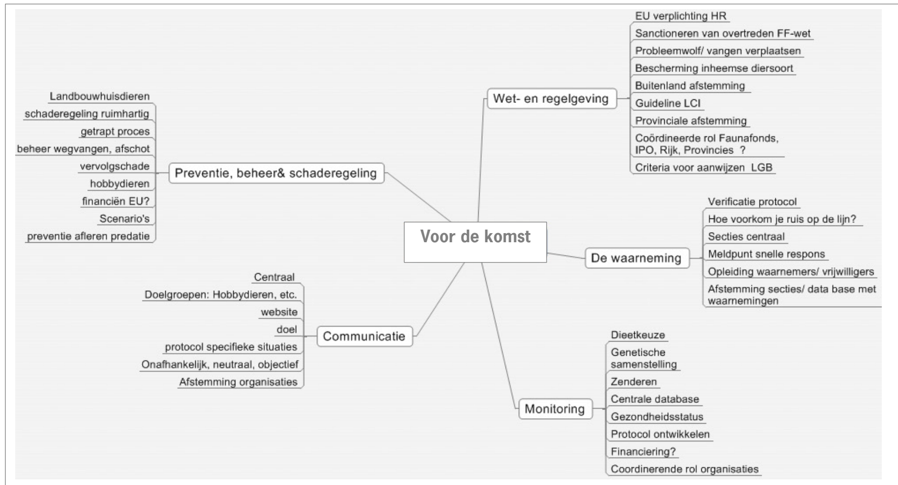
Figuur 1 Vóór de komst.