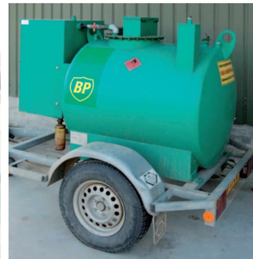
▲ Vergeet niet de mobiele tankwagen aan het eind van de dag af te vullen en te stallen op een afgesloten plek. Als dat niet mogelijk is, zet de wagen dan op een goedverlichte plek.