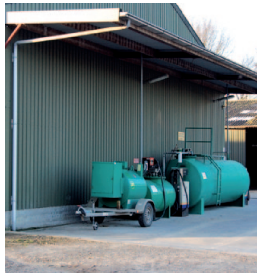
▲ Overweeg de voorraadtank een plek te geven die vanuit huis zichtbaar is en om de installatie te voorzien van bewegingssensoren die ervoor zorgen dat de verlichting aangaat als er iemand in de buurt komt van de voorraadtank.