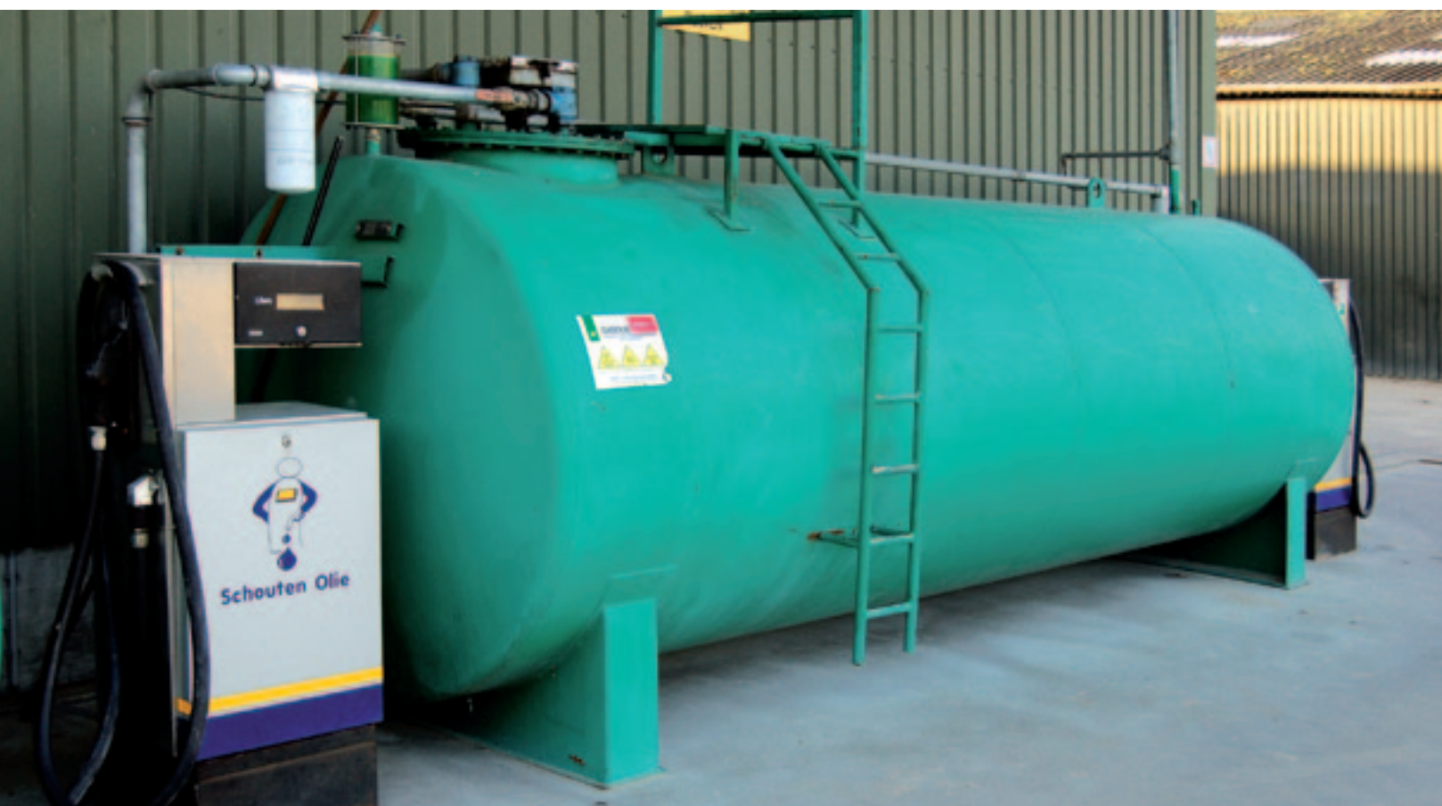
▲ Bij installaties met een elektrische pomp is het raadzaam om 's nachts de stroom af te sluiten. Loonbedrijven zouden kunnen overwegen om het personeel een tankpas te verstrekken.