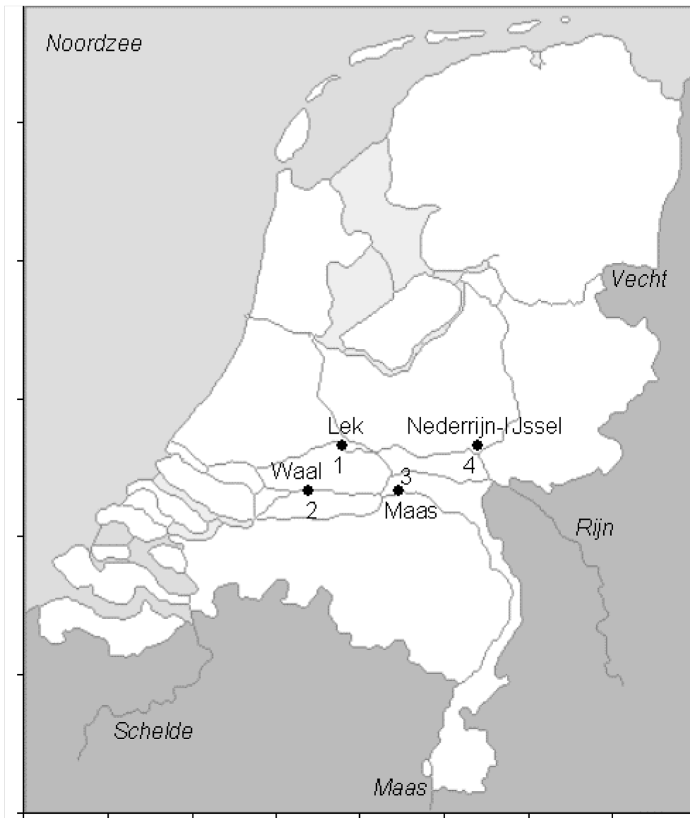
Figuur 2. Overzicht van de locaties van de zalmsteken die worden geregistreerd.

Voor de visserij met zalmsteken gedurende de sluiting van de aalvisserij in september-november is wel ontheffing verleend door het Ministerie van EZ Dienst Regelingen. Hierdoor heeft de visserij gewoon plaatsgevonden. De tweede periode is net afgesloten (oktober tot eind november). Deze gegevens en logboeken moeten grotendeels nog verzameld worden van de desbetreffende beroepsvissers. Invoer van alle gegevens zal in december 2012- februari 2013 plaatsvinden.