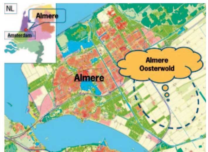
Figuur 1. Almere Oosterwold is een van de gebieden die in het kader van Almere 2.0 ontwikkeld zal worden. Oosterwold, ruim 4000 hectare groot, is het gebied waarop Agromere zich concentreerde.

De Agromere Arena kan, achteraf beschouwd, in vier fasen worden opgedeeld: proloog , inform , consult en collaborate . Te beginnen bij de proloog. Agromere vindt zijn oorsprong in een multisectorale toekomstverkenning van de landbouw die Wageningen UR in 2000-2002 uitvoerde in opdracht van voormalige Ministerie van Landbouw, Natuur en Voedselkwaliteit (LNV). De verkenning voor de plantaardige sector bracht zicht op een nieuwe ontwikkeling – Stad en land integreren: nieuwe rondes, andere kansen – met de constatering dat landbouw een waardevolle functie kan hebben voor de stad (Klein Swormink en Krikke, 2004). De landbouw weer een functie geven in