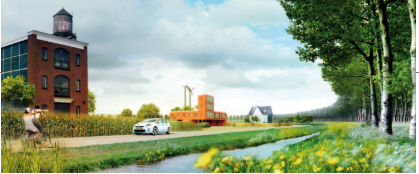
Een impressie van verweving van stad, landbouw en recreatie in Almere Oosterwold.

van het ontwerpteam van Almere 2.0. Hoewel maar een klein deel van dit team eerder betrokken was bij Agromere reageerde die enthousiast op stadslandbouw. Het Agromere-team werd gevraagd mee te denken. Het kreeg ook de opdracht om uit te rekenen hoeveel voedsel er lokaal in Almere Oosterwold geproduceerd kan worden en in hoeverre deze lokale productie bijdraagt aan de reductie van de klimaatparameters van de stad, zoals de carbon footprint (Sukkel et al., 2010). Hoewel de bijdrage van Almere Oosterwold aan zowel het voedselmandje als de reductie van de klimaatparameters relatief beperkt lijkt, verwoordde Almere – in haar structuurvisie – de ambitie om in 2030 10 procent van haar voedselmandje lokaal te produceren. In de conceptstructuurvisie die zomer 2009 uitkwam, sprak Almere de ambitie uit om in Almere Oosterwold landbouw en stad samen te ontwikkelen naar nieuwe vormen van stadslandbouw of landbouwstad (Almere, 2009). Almere greep daarbij terug naar haar oorspronkelijke DNA, de Garden City van Ebenezer Howard. Het stadslandschap moet transformeren van kijkgroen naar productief landschap (Almere, 2011). Voor Almere Oosterwold betekent dit dat minimaal 50 procent van het toekomstige stedelijke landschap in agrarische productie blijft (Almere, 2012).