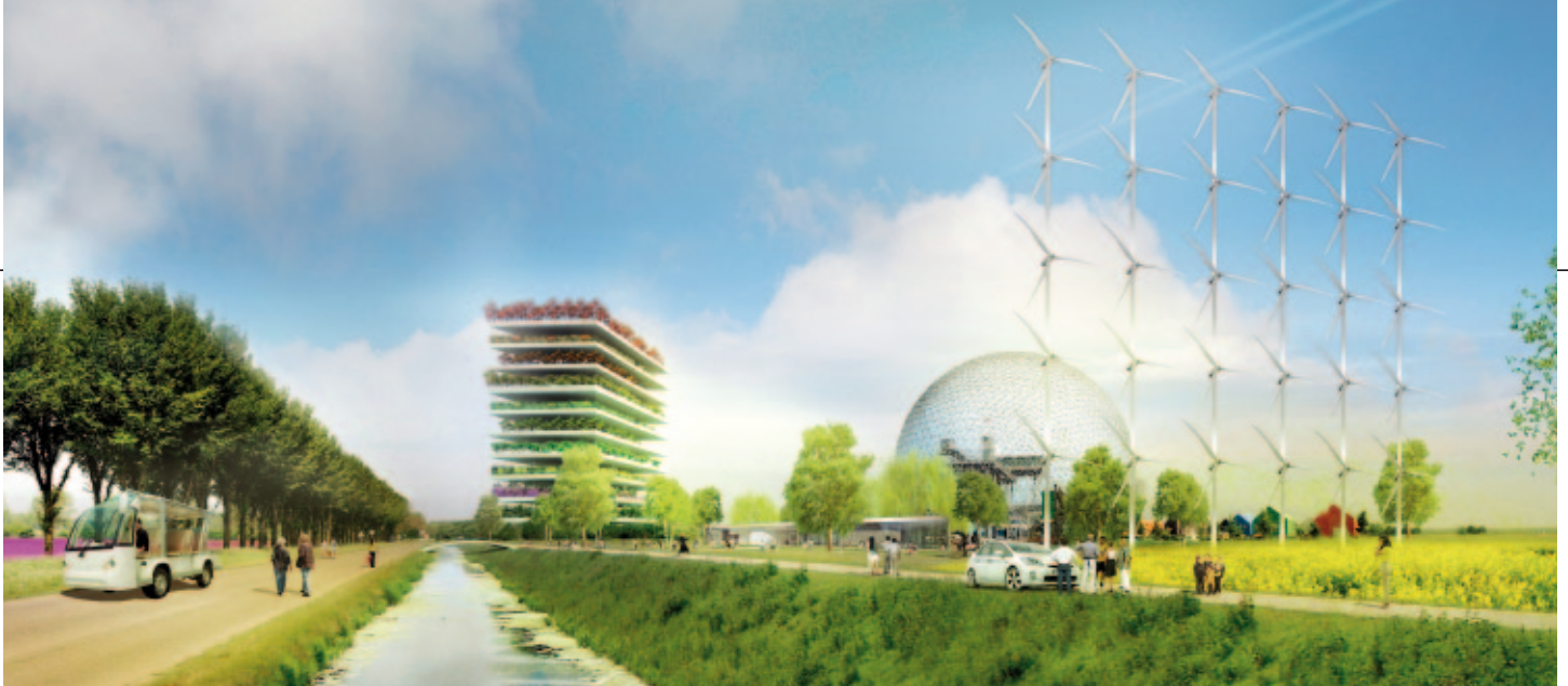
Impressie van verweving van stad en land in de te ontwikkelen wijk Oosterwold in Almere.

Agromere startte daarom met de vraag of en hoe stad en landbouw op een natuurlijke wijze weer verbonden kunnen worden in Almere. Een complexe vraag waarop zeker in 2004 niemand een antwoord had. De rode draad was het denken vanuit de belanghebbenden, de stakeholders. Diverse typen interventies werden toegepast om hen te beïnvloeden, te inspireren en uit te dagen. De kern van deze interventies vormde een drietal workshops waarin toekomstbeelden werden omgezet in een virtuele woonwijk.