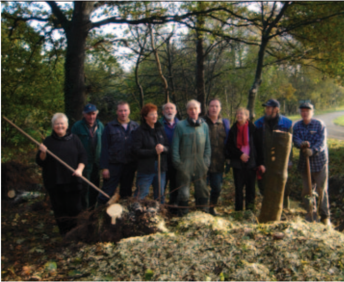
Bewoners uit een aantal Drentse buurtschappen hebben zich verenigd in de Stichting Boermarkte Essen en Aa's om zelf invulling te geven aan de ontwikkeling van hun eigen omgeving.

processen in regio's). Dit sluit aan bij de nationale en Europese beleidskaders. Die gaan er in eerste instantie vanuit dat de positie van regio's is te versterken door inzet van technologie (Rutten and Boekema, 2007). Dit kan op het eerst gezicht de indruk wekken van een logistiek of infrastructureel vraagstuk. Echter, dit is maar één kant van het verhaal. Het draait misschien nog wel meer om de vraag hoe verbindingen tussen mensen en organisaties tot stand komen.