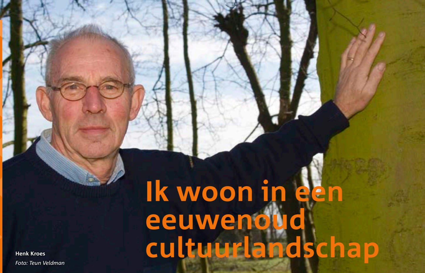
Henk Kroes