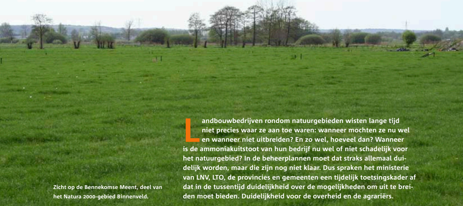
Zicht op de Bennekomse Meent, deel van het Natura 2000-gebied Binnenveld.

L andbouwbedrijven rondom natuurgebieden wisten lange tijd niet precies waar ze aan toe waren: wanneer mochten ze nu wel en wanneer niet uitbreiden? En zo wel, hoeveel dan? Wanneer is de ammoniakuitstoot van hun bedrijf nu wel of niet schadelijk voor het natuurgebied? In de beheerplannen moet dat straks allemaal duidelijk worden, maar die zijn nog niet klaar. Dus spraken het ministerie van LNV, LTO, de provincies en gemeenten een tijdelijk toetsingskader af dat in de tussentijd duidelijkheid over de mogelijkheden om uit te breiden moet bieden. Duidelijkheid voor de overheid en de agrariërs.