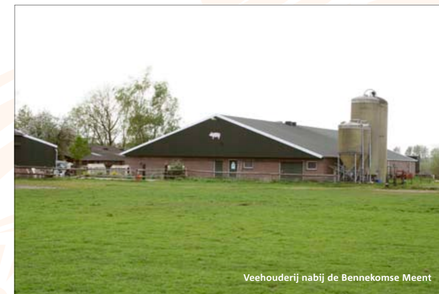
Veehouderij nabij de Bennekomse Meent