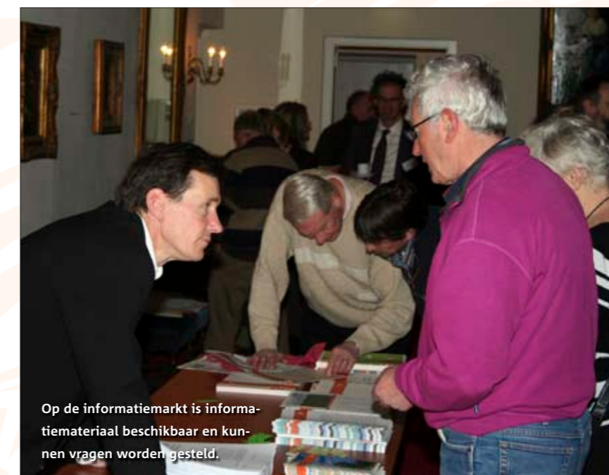
Op de informatiemarkt is informatiemateriaal beschikbaar en kunnen vragen worden gesteld.

en de Noordzeekustzone vanaf de grens met Duitsland tot aan Petten. Meer informatie hierover is te vinden op: www.minlnv.nl > natuurwetgeving.