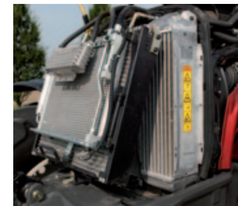
Het koelpakket van de N163 scharniert eenvoudig. Daardoor is het goed mogelijk de koeling te reinigen.