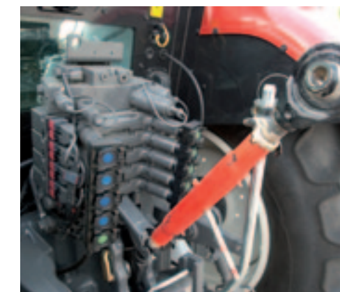
De ophanging van de topstang (ook die van de frontheff) verdient een compliment. De kleurcodering van de hydrauliekventielen is verwarrend.

De motor van de N163 komt bij transport niet boven de 1.700 toeren uit en haalt een top van bijna 54 km/h. Het kleine stuurteje maakt manoeuvreerwerk tot een aangename bezigheid en remmen doet de N163 als de beste – de eerste keer schrik je daar bijna van. Bij het werken met ontkoppelde pedalen en breed 'schoeisel' zorgt de opstaande rand voor wat irritatie.