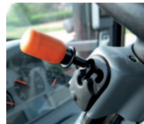
Zodra je de omkeerschakeling uit de P-stand haalt, stijgt het toerental van 650 naar 850 toeren per minuut.

handbediening heb je het instructieboek nodig. De cvt is opgebouwd uit vier groepen, die je met een weggestopt hendeltje rechts van de armleuning vastlegt. De schakelmomenten tussen de groepen zijn tijdens het rijden nauwelijks waarneembaar. Voor veehouders die een cvt toch wat te veel van het goede vinden, is er ook de N163 Versu met dertig versnellingen voor en achteruit.