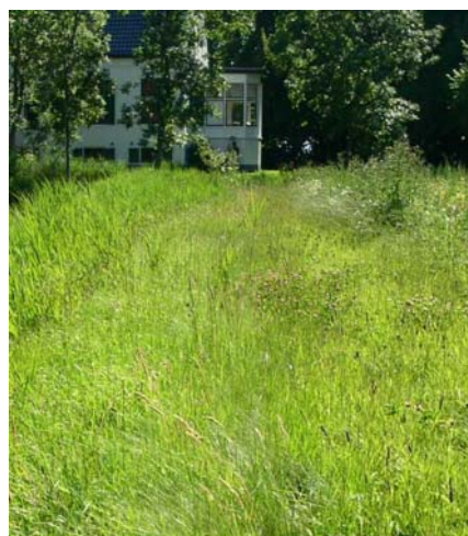
Foto 1: Natuurstrook bij akkerbouwbedrijf Meijer te Kloosterburen. Links rand in 1 ste jaar van verschraling (2002), rechts zelfde rand in 2 de jaar van verschraling (2003)