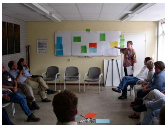
Foto 8: Communicatie deskundige geeft uitleg over 'open space' activiteit tijdens landelijke dag

Na aanleiding daarvan zijn door de bezoekers de volgende onderwerpen aangedragen, die in kleine groepjes zijn bediscussieerd (foto 9):