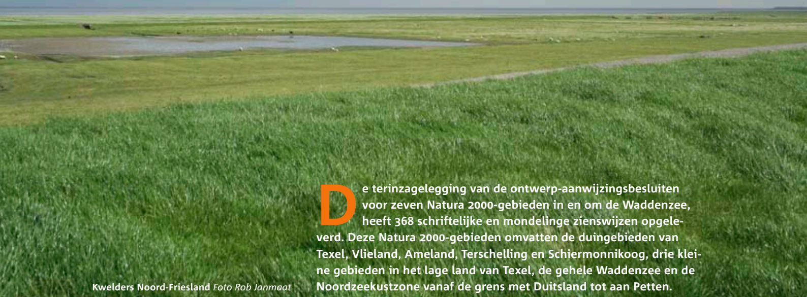
Kwelders Noord-Friesland

D e terinzagelegging van de ontwerp-aanwijzingsbesluiten voor zeven Natura 2000-gebieden in en om de Waddenzee, heeft 368 schriftelijke en mondelinge zienswijzen opgeleverd. Deze Natura 2000-gebieden omvatten de duingebieden van Texel, Vlieland, Ameland, Terschelling en Schiermonnikoog, drie kleine gebieden in het lage land van Texel, de gehele Waddenzee en de Noordzeekustzone vanaf de grens met Duitsland tot aan Petten.