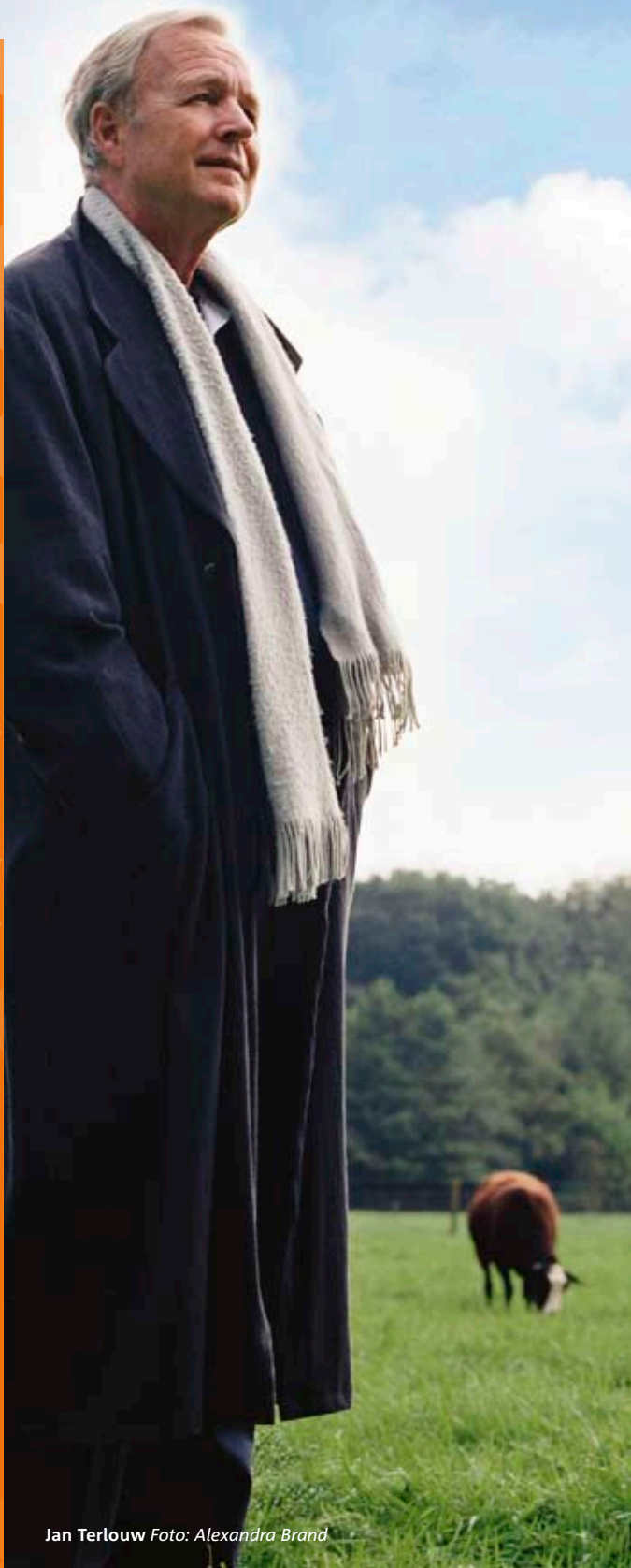
Jan Terlouw