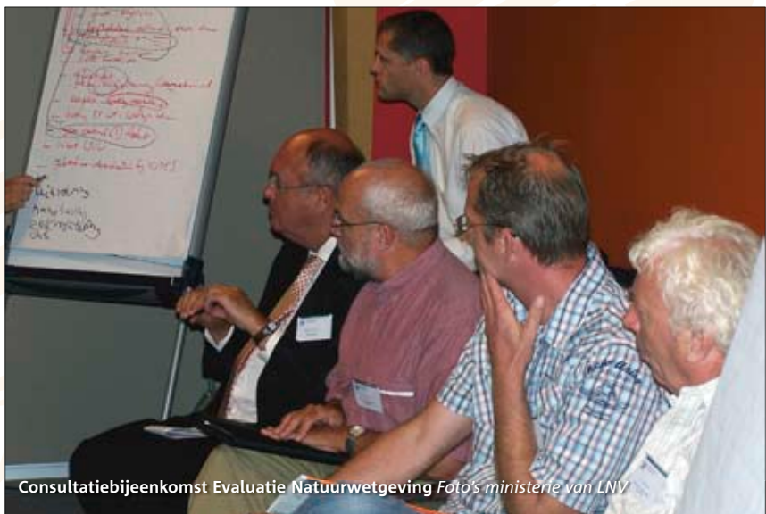
Consultatiebijeenkomst Evaluatie Natuurwetgeving

“Het gaat erom dat we op een werkbare manier onze natuurdoelen bereiken, en of dat dan met één of drie wetten gebeurt, dat is eigenlijk niet zo interessant.”