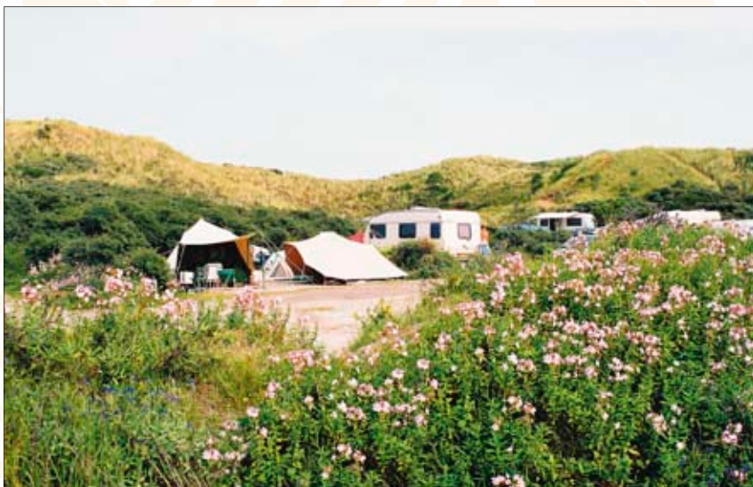
Kennemer duincamping "de Lakens"

ten in hun standpunten. In presentaties van inmiddels opgestelde concept-beheerplannen, bleek ook dat recreatie best een plek kan behouden in een Natura 2000-gebied. Zo leverde het opstellen van het beheerplan voor de Voordelta de nodige spanning en discussie op, maar nadat Rijkswaterstaat het beheerplan leesbaar en toegankelijk had gemaakt, en de recreatieondernemers op hun beurt zich de nodige kennis over natuur en Natura 2000 eigen hadden gemaakt, bleek dat het beheerplan zowel de natuurbelangen als de belangen van de recreatiesector dient. Met name extra profilering door het feit dat een recreatieondernemer in of nabij een Natura 2000-gebied zit, kan ondernemers juist voordelen bieden ten opzichte van de collega-bedrijven. Een ander voordeel van het beheerplan voor de (recreatie) ondernemers is dat duidelijk wordt wat wel en wat niet vergunningplichtig is.