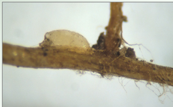
Achterkant van een vrouwelijk exemplaar van Heterodera schachtii op het wortelstelsel.

Als voorvrucht cysteaaltjes vermeerderende gewassen (bieten, krotten, spinazie, koolzaadgewassen of andere koolsoorten) vermijden. In het geval van het gele bietencysteaaltje ook vlinderbloemige gewassen vermijden omdat de gele bietencysteaaltjes hier sterk op vermeerderen. Er zijn tegen beide soorten cysteaaltjes resistente bladrammenas en gele mosterdrassen beschikbaar.