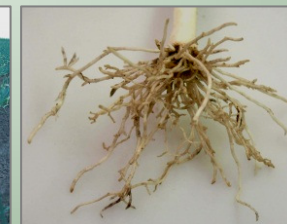
Schade in prei door Trichodoriden