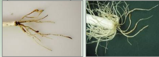
Schade door Meloidogyne chitwoodi .

achterblijft. Later groeit het gewas er over heen. Ondergronds is te zien dat de wortels verdikt zijn doordat het aaltje knobbeltjes vormt.