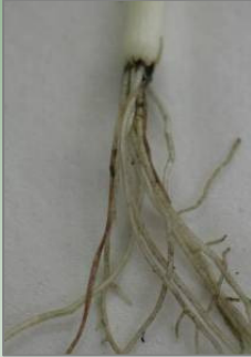
Schadebeeld van Pratylenchus penetrans .

Dit aaltje vermeerdt zich sterk op prei. Bovengronds is alleen bij hoge dichtheden een groeiachterstand te zien. Dit zal veelal volvelds zijn waardoor het niet direct opvalt, behalve dat de prei ook minder uniform qua maat zal zijn. Ondergronds zijn bruine lesies op de wortels van de planten te zien veroorzaakt door het binnendringen van de aaltjes.