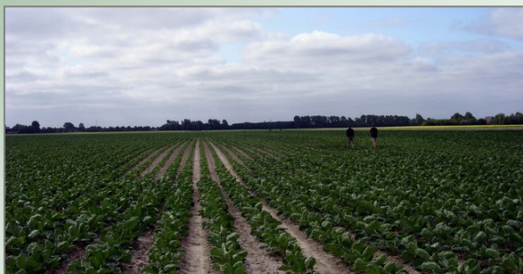
Pleksgewijze uitblijvende groei in spruitkool door Heterodera schachtii

Er zijn twee verschillende bietencysteaaltjes die in koolgewassen kunnen optreden; het witte bietencysteaaltje, Heterodera schachtii , dat zowel op klei als zand voorkomt en het gele bietencysteaaltje, Heterodera betae , dat vooral op het zand problemen veroorzaakt. Behalve voor bieten zijn deze soorten ook schadelijk voor krotten, spinazie en koolsoorten (vooral spruitkool). Het gele bietencysteaaltje is bovendien nog schadelijk voor vlinderbloemigen waar dit bietencysteaaltje zich ook op vermeerderen kan.