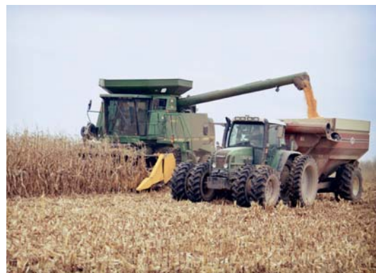
Op de 70 hectare verbouwen en oogsten ze zelf ccm en sojabonen.