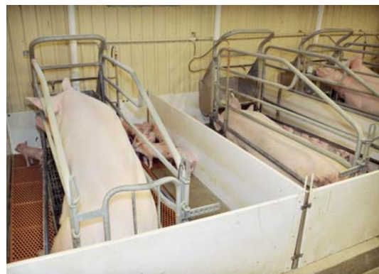
Het gesloten bedrijf telt 140 zeugen en 1.000 vleesvarkens.