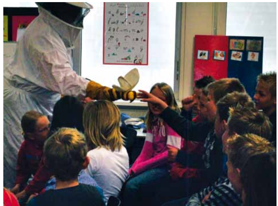
Foto boven: Zo beschermt een imker zich... Foto onder: Hier is dan de koningin

meteen roepen dat ze geen honing lusten. Het stokje willen ze wel. En als dan blijkt dat de buurman de lik honing op zijn stokje heerlijk vindt, willen ze ook. Tot besluit een quizje. Hoe vaak moet een bij op en neer vliegen om dat hapje honing op jouw stokje te verzamelen? Elk kind raadt een getal en die komen allemaal op het bord. Uit die collectie cijfers worden op een of andere manier een eerste, tweede en derde prijs getoverd en die kinderen krijgen een ansichtkaart: reproductie van een van de iconen voor Geometer, kleurrijke schilderijen die eerbewijzen aan de geometrische schoonheid van de schepping, werk van Pieter. Margaretha is nog niet klaar. Zij rekent