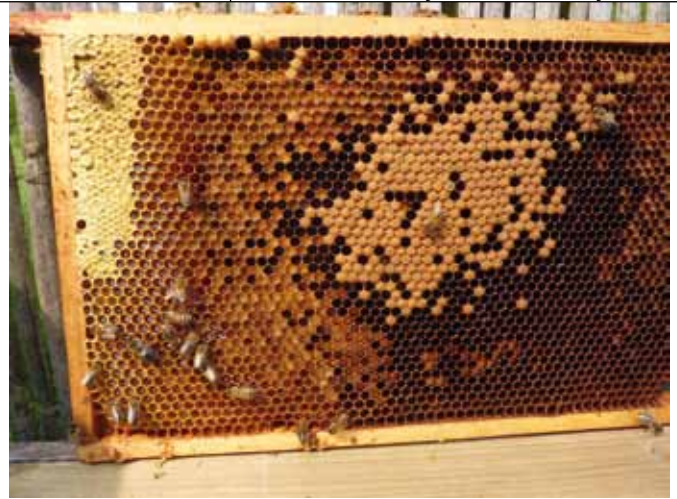
Een mooie voorraad stuifmeel, maar bij slecht weer is de voorraad honing snel verdwenen en stagneert de ontwikkeling