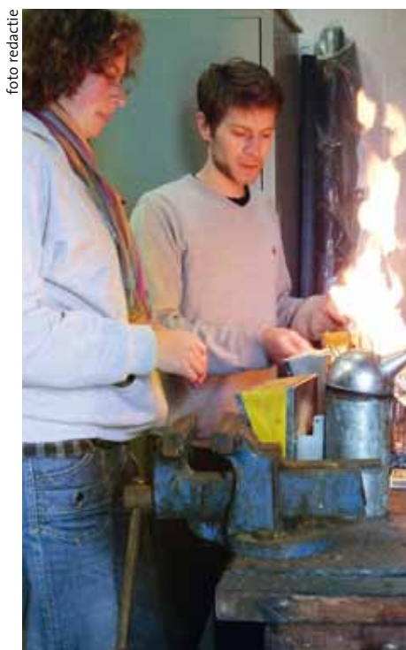
Een handberoker aansteken...

Op www.bijenhouders.nl > tijdschrift > aanvullingen juni 2011 zijn de websites te vinden waarmee College Beekeeper zijn web-onderwijs vult.