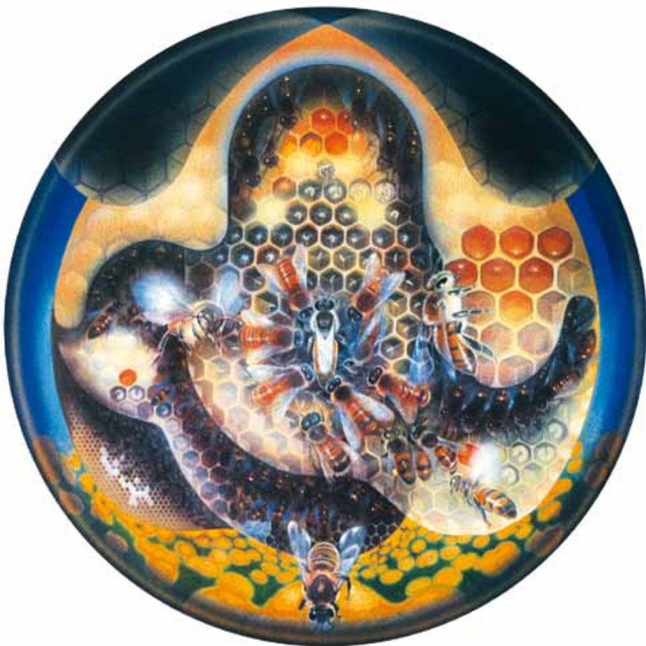
'Het leven der bijen' door Pieter Torensma. Zie ook www.pietertorensma.nl

Dan is de beurt aan Pieters dia's: traditionele beelden van kasten en korven, van raten en imkers – wat je verwacht als argeloze bezoeker bij zo'n les met een diaprojector. Maar opvallend zijn de dia's waarop plantaardige vormen getoond worden: een pollenkorrel met 3 punten, een bloem van een kardinaalsmuts met 4 blaadjes, een doorgesneden appel met 5 pitten, een cel uit de raat met 6 hoeken. Opgetogen tellen de kinderen spontaan het opklimmende aantal punten en uitsteeksels op de plaatjes en Pieter heeft ze hiermee vast en zeker het juiste zetje gegeven om goed te kijken, ook buiten. Margaretha weeft er het verhaal over bloembezoek door de bij tussendoor. Hoe