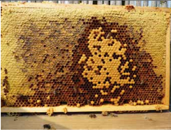
Met een aantal ramen met zoveel voer kan het bijenvolk zich goed voorbereiden op de overschakeling van zomerbijen naar winterbijen