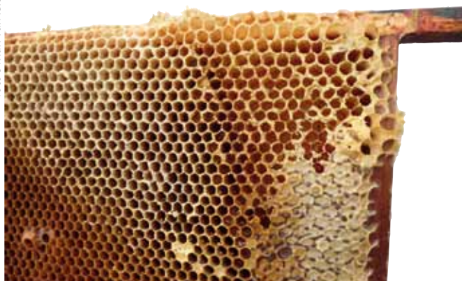
De raat wordt leeggeroofd. Let op de ruw opengebroken cellen