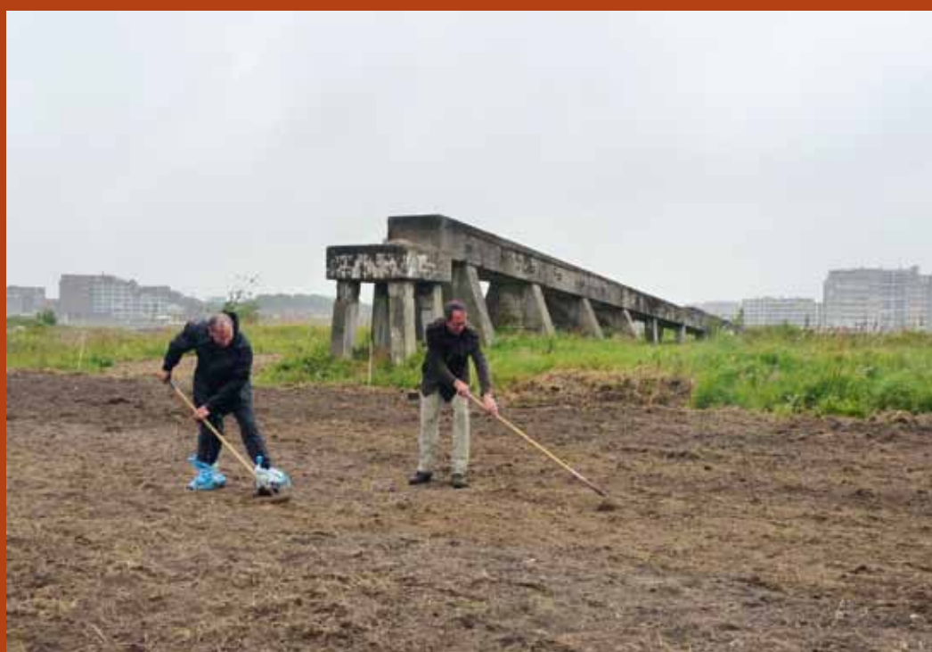
Dordrecht: klaarmaken voor inzaai

En lest maar niet best: het initiatief om bijen te adopteren. De site http://adopteereenbijenvolk.net laat een schaamtevol voorbeeld zien van hoe een initiatief zijn doel ook voorbij kan schieten wanneer de organisatie niet op orde is. Dit is slechte PR voor de imkerij. Ik had me als imker aangemeld om een volk ter adoptie aan te bieden maar stuitte op volledige doofheid. En blijkens het gastenboek ben ik niet de enige die geen gehoor vind. Waar het geld blijft dat via de adoptie binnenkomt, is nog steeds een raadsel. Het gebrek aan transparantie is stuitend.