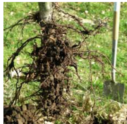
Het worteltesie-aaltje heeft desastreuze effecten op het wortelstelsel.

Momenteel is er veel aandacht voor mycorrhizaschimmels en dan vooral Arbusculaire Mycorrhizale Fungi (AMF). Deze schimmels leven in symbiose samen met de wortels van planten. Hierdoor wordt het contactoppervlak tussen de boom en de bodem vergroot. Zo faciliteren de schimmels de opname van bodemfosfaat, water en andere essentiële elementen uit de bodem. Ook zijn er reeds belangrijke aanwijzingen dat het toepassen van AMF kan leiden tot het onderdrukken van plantpathogene bodemschimmels en nematoden.