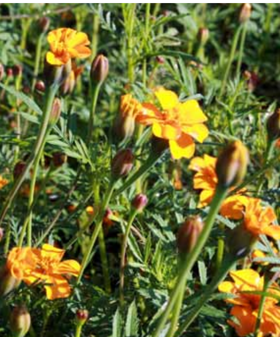
Tagetes patula (Afrikaantjes).

neer de bomen reeds zijn geplant. Omdat fruitteelt een meerjarige teelt is, is dit nog moeilijk op te lossen. Bovendien is het binnen de biologische teelt nog veel moeilijker om hier iets aan te doen. Toch is dat wel noodzakelijk, want een slecht groeiende aanplant zorgt voor een groot financieel verlies voor de teler.