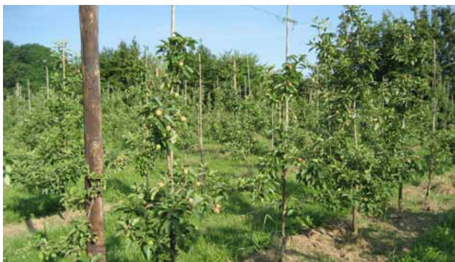
Bodemmoeheid in Topaz aanplant.

Land- en tuinbouwbedrijven zijn zich de laatste decennia sterk gaan specialiseren. Door die specialisatie ligt teeltrotatie niet langer meer binnen de mogelijkheden. Hierdoor nemen de problemen met bodemmoeheid sterk toe. De herinplant in de fruitteelt is alleen mogelijk als de bodemmoeheid wordt aangepakt. Alternatieve methoden van grondontsmetting waren tot nu toe in de meeste gevallen minder effectief of in vergelijking met chemische grondontsmetting veel duurder.