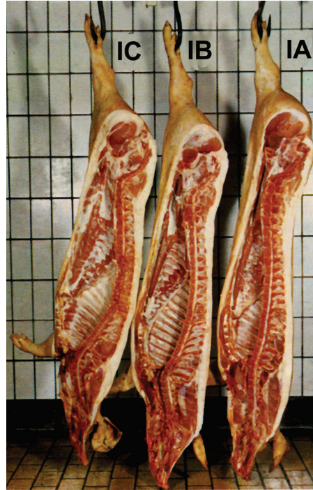
CLASSIFICATIE-INDELING NAAR SPEKDIKTE (LINKS) EN TYPE (RECHTS)

In 1975 werd de classificatie en de uitbetaling naar kwaliteit verplicht gesteld. Tegelijkertijd werd nog een extra klasse ingevoerd, de EAA voor excellente vleesvarkens met extra dun spek en een best type.