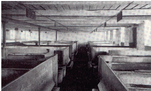
EERSTE DEENSE SELECTIEMESTERIJ IN ELSMINDE

Vooral de coöperatieve Deense exportslachterijen hebben de fokkerij en het selectiemesterijonderzoek sterk gestimuleerd. De bereikte resultaten zijn indrukwekkend. Denemarken kreeg hiermee op het gebied van organisatie, onderzoek en fokkerij een wereldnaam en een grote voorsprong op Nederland. Het Deens Landvarken werd naast het Engelse Large White of Groot Yorkshire een grote genetische bron in de wereld van de varkensfokkerij.