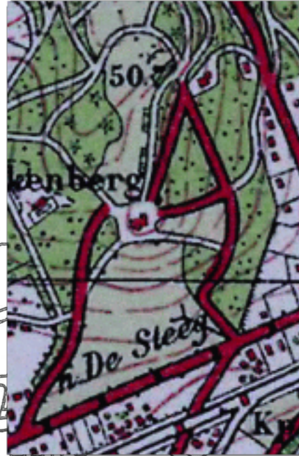
Oude zichtlijn herstellen