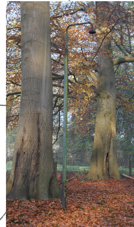
Pad volgt origineel tracé, bestaande laan waar nodig versterken