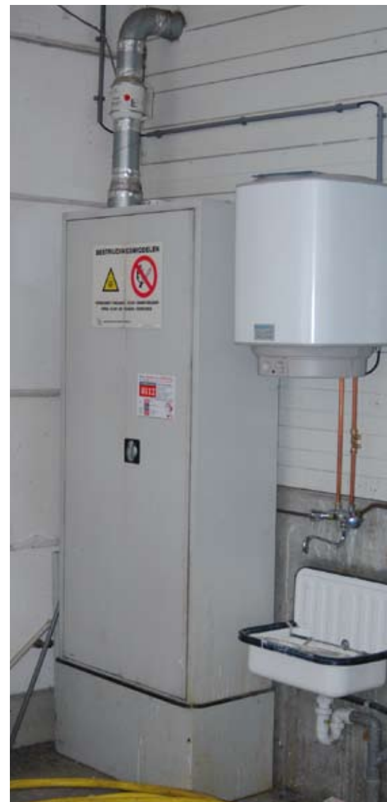
Of laten we de trofee achter op de Efteling in Kaatsheuvel? Waar veiligheid hoge ogen gooit.

Een ander jurylid vult aan: “Vanuit onze professie maken we nog een kanttekening bij het sleutelen in de eigen werkplaats. Ook daar is specifieke kennis nodig. Opleidingen en bijhouden van kennis van nieuwe technieken en apparatuur zijn nodig. Bij bedrijven als Jean Heybroek en Pols Zuidland gebeurt dat. In de praktijk van het golfbedrijf zien we nog wel eens dat het management besluit het sleutelen zelf te doen, om de medewerkers aan het werk te houden. Het is de vraag of dat efficiënt is, economisch verantwoord en of dat het goed onderhoud ten goede komt.”