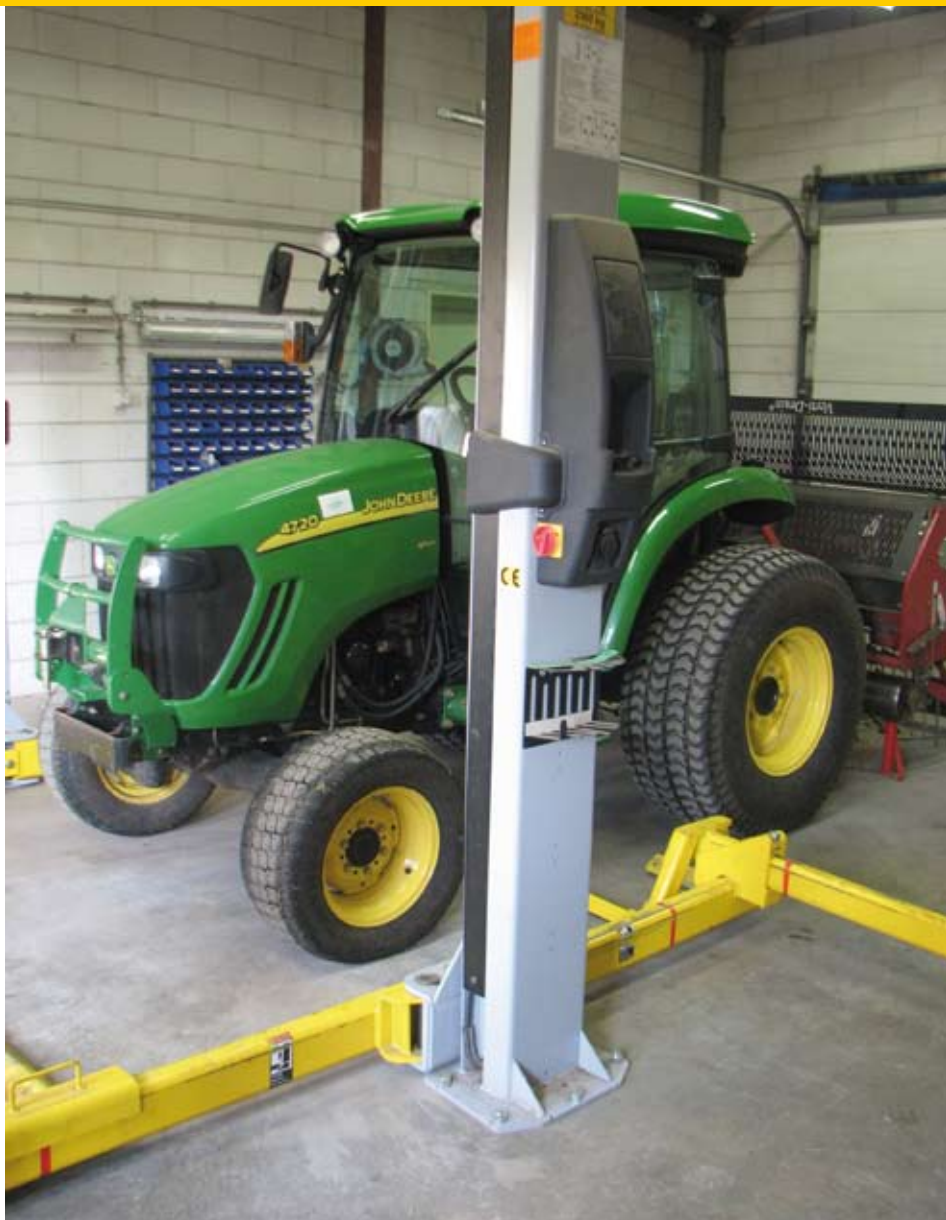
Misschien verdient de baan in Lochem de Gouden Dopsleutel vanwege die bijzondere hefbrug.