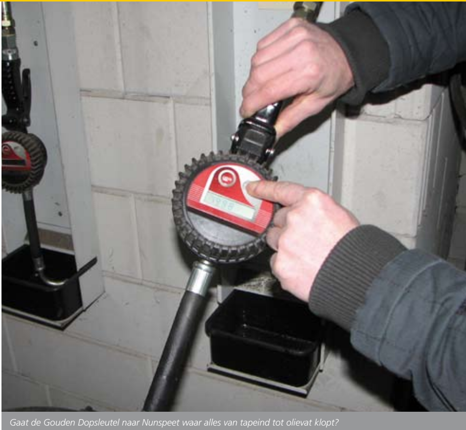
Gaat de Gouden Dopsleutel naar Nunspeet waar alles van tapeind tot olievat klopt?