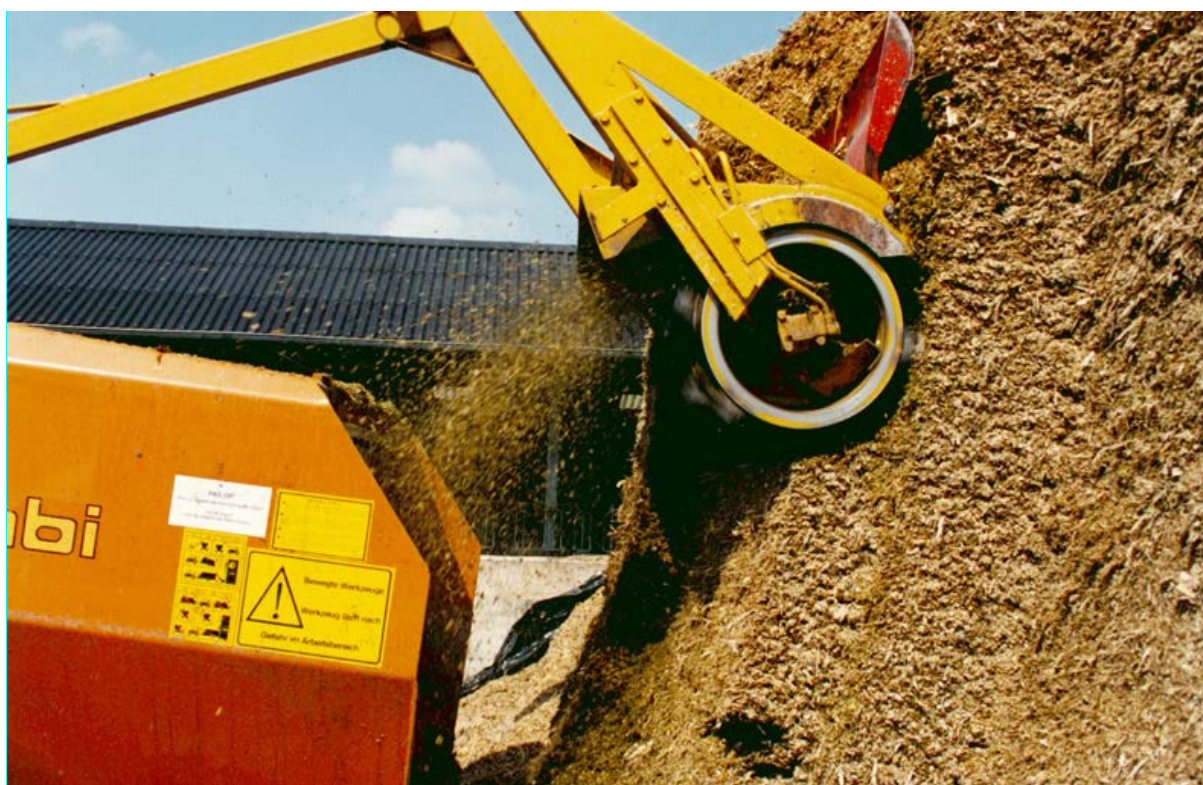
Snijmaïs dankt zijn hoge voederwaarde met name aan het hoge zetmeelgehalte