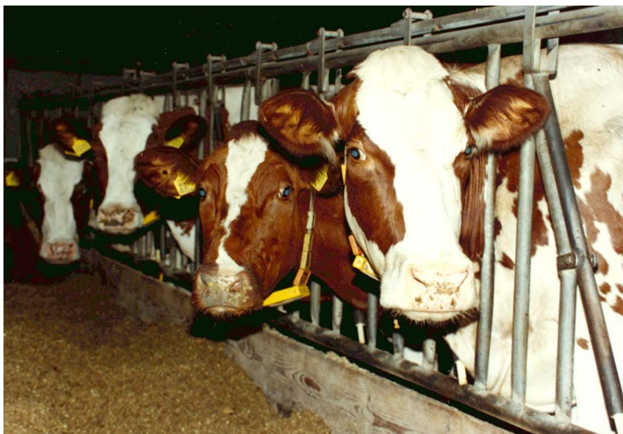
Uitsluitend snijmaïs voor melkkoeien op Cranendonck van 1986-1991

Onder sommige specifieke bedrijfsomstandigheden kan het een optie zijn om uitsluitend snijmaïs als ruwvoer te gebruiken, bijvoorbeeld als er geen of een te kleine huiskavel is of wanneer er geen of te weinig grond beschikbaar is voor ruwvoerproductie. Op praktijkcentrum Cranendonck is een systeemvergelijking uitgevoerd tussen een bedrijfssysteem met gras en snijmaïs en systeem met uitsluitend snijmaïs.