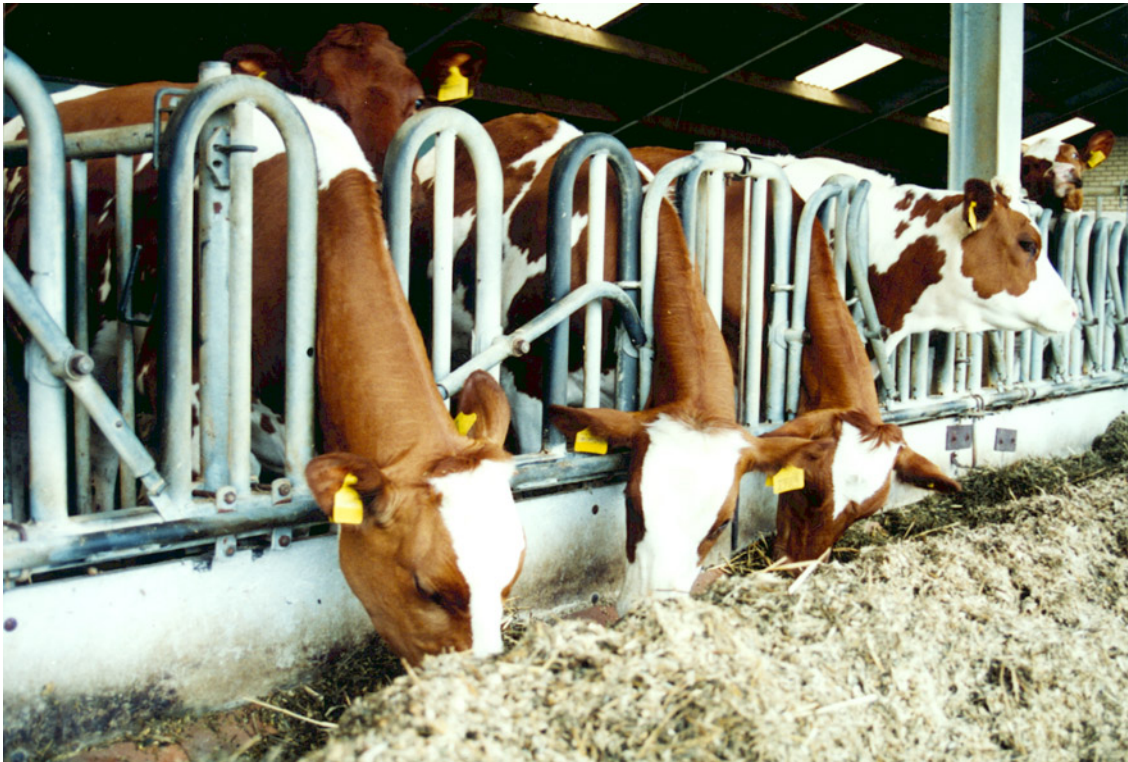
Grotere kans op vervetting bij jongvee met veel snijmaïs

Snijmaïs past ook goed in rantsoenen voor jongvee, maar ook hier bestaat een risico voor vervetting. Bij jongvee jonger dan 1 jaar dat naast ruwvoer nog (eiwitrijk) krachtvoer krijgt, kan men snijmaïs als enig ruwvoer gebruiken. Bij het oudere jongvee moet de hoeveelheid snijmaïs worden beperkt tot maximaal 40% van het ruwvoer.