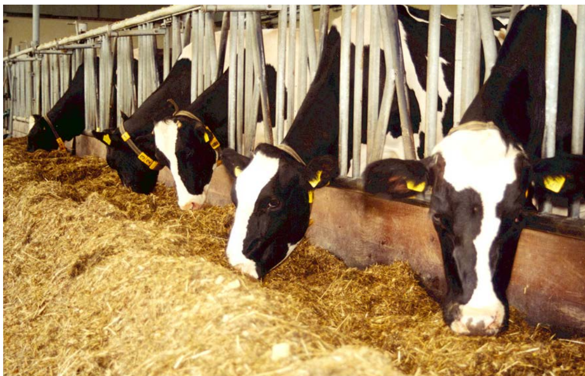
Goede voeropname met snijmaïs