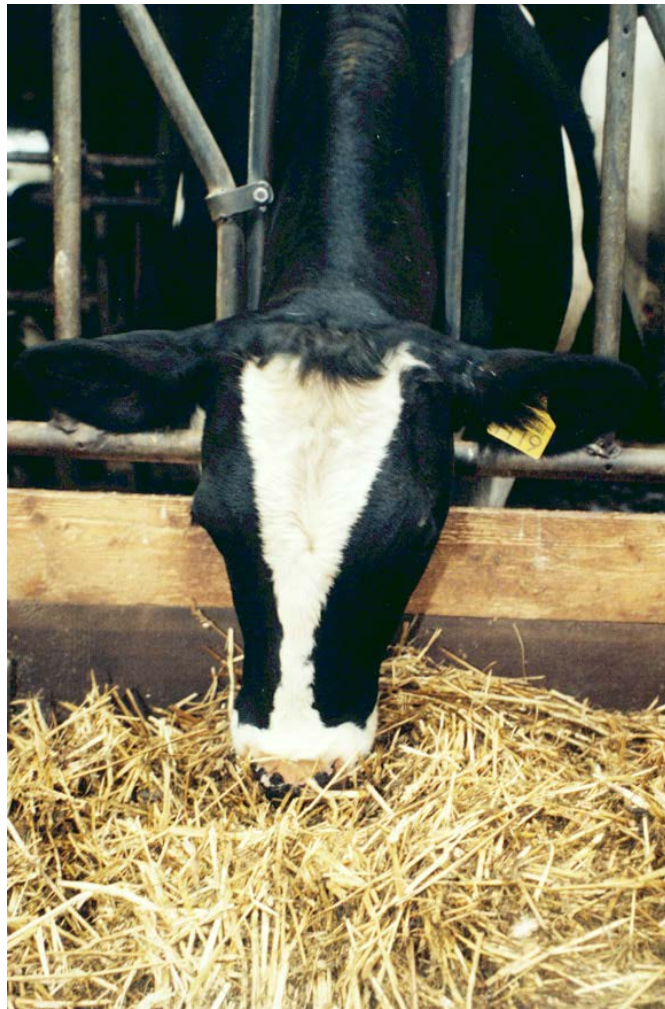
Stro in het rantsoen kan structuurgebrek opheffen