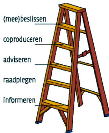
Figuur 1 Participatietrap

Tussen de twee uiterste maten van burgerparticipatie zijn er een aantal andere mogelijkheden die simplistisch worden weergegeven in de participatietrap: