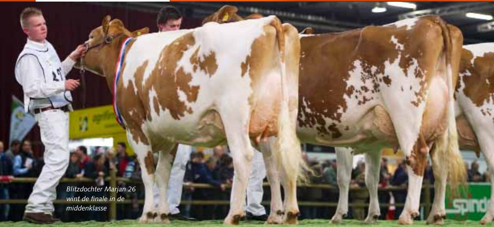
Blitzdochter Marjan 26 wint de finale in de middenklasse