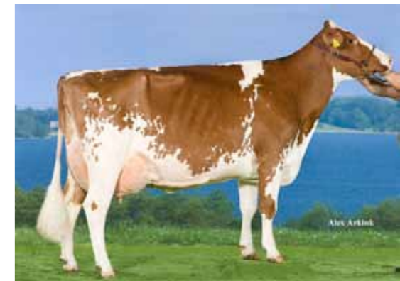
Barend. Emma 192 (v. Classic), res.kamp. midden Prod.: 3.07 376 13.624 3,65 3,32 lw 102