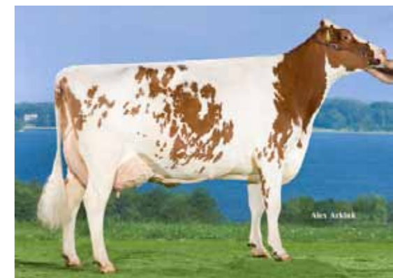
J&G Trilux 18 (v. Classic), res.kamp. senioren Prod.: 3.11 369 14.662 4,29 3,51 lw 116