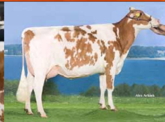
Bons-Holst. Aaltje 94 (v. Talent), kamp. vaarzen Prod.: 2.07 197 7634 4,02 3,57 lw 126