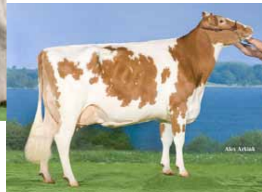
Marjan 26 (v. Blitz), algemeen kampioene Prod.: 2.05 329 9739 4,16 3,46 lw 115