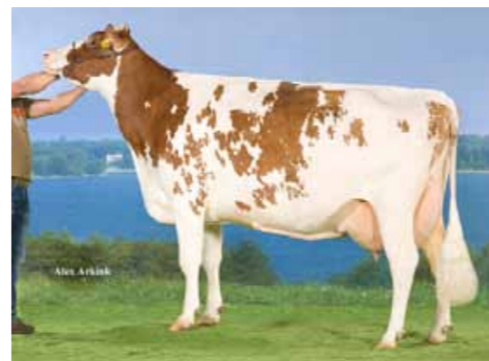
Barend. Wilma 208 (v. Classic), kamp. senioren Prod.: 4.07 439 12.707 5,51 4,13 lw 96