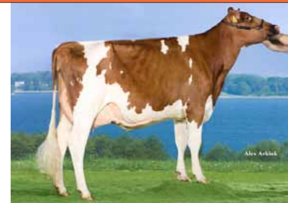
JU Lonia 154 (v. Tequila), res.kamp. vaarzen Prod.: nog niet bekend

Een zwaardere strijd was er in de oudste rubriek, zo wist ook de zakelijk opererende speaker Ids Hellinga. Hier kruisten de algemeen NRM-kampioene van 2010 J&G Trilux (v. Classic) en de seniorenkampioene van NRM 2012 Barendonk Wilma 208 (v. Classic) de degens. Het werd