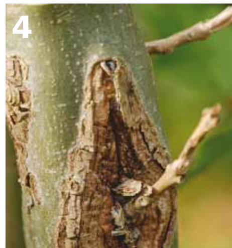
Fase 4. Sterfte van de tak met typische wigvormige necrose eerst onder en vervolgens ook boven de takaanhechting. Op de foto is de aantasting al ouder en daarom al aan het verhouten.