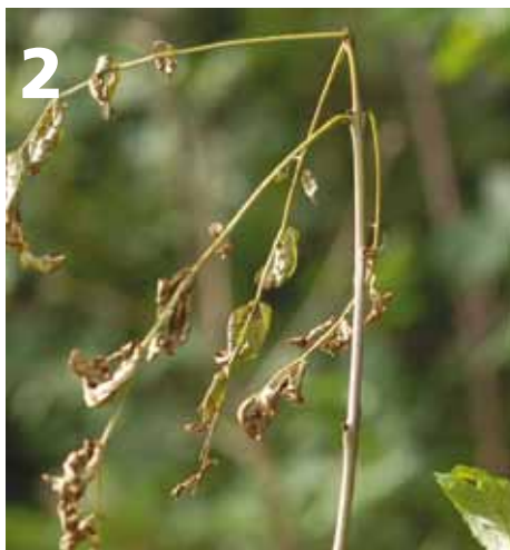
Fase 3. Sterfte van de twijg met typische geel/oranje verkleuring van de aangetaste plek. Op de foto is zichtbaar dat onder de bast de verspreiding van de schimmel al verder is dan aan de buitenkant van de tak zichtbaar is.