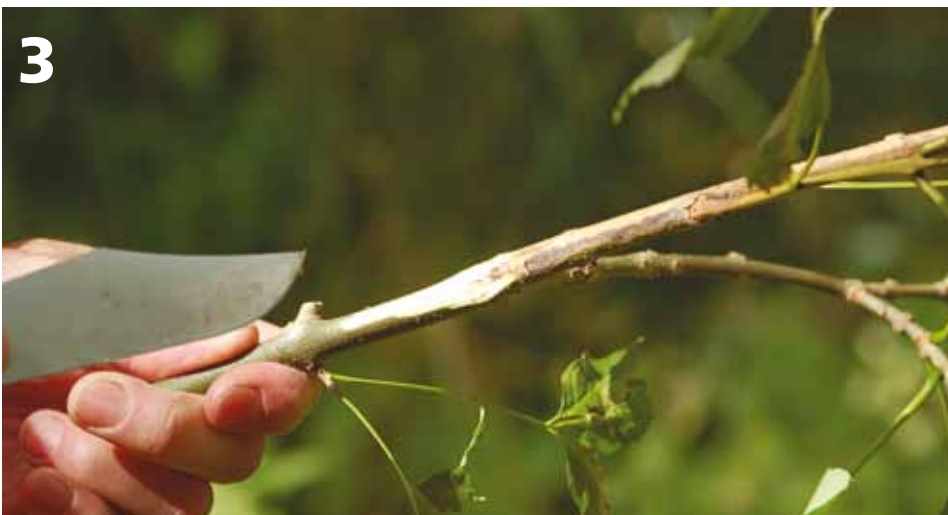
Fase 2. Verwelking van blad. Doordat de verwelking laat in de zomer plaatsvindt, wanneer niet-geïnfecteerde bladeren nog fris groen zijn en de vlekjes op de bladsteel te zien zijn, is visuele herkenning van ETS goed mogelijk.

schimmel Hymenoscyphus pseudoalbidus vaak overgroeid is door andere aanwezige schimmels die dan wel kunnen worden herkend.