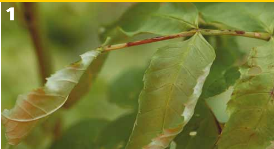
Fase 1. Sporen komen terecht op het blad en de bladsteel. Na infectie van het blad via de sporen ontstaan op de bladsteel donkere (rode/bruine) vlekjes. Deze vlekjes zijn zeer goed herkenbaar op de groene bladsteel.