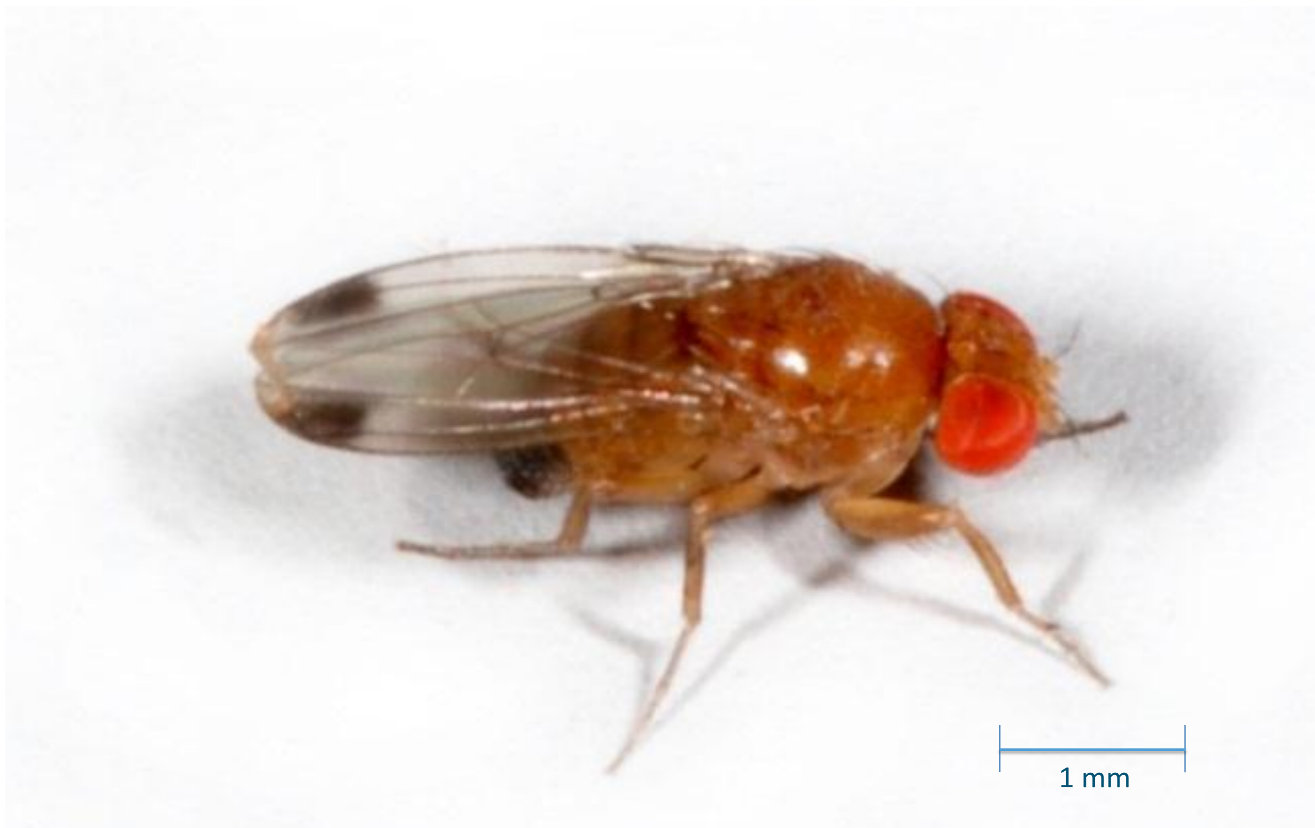
Mannetjes met donkere vlekken op de vleugels