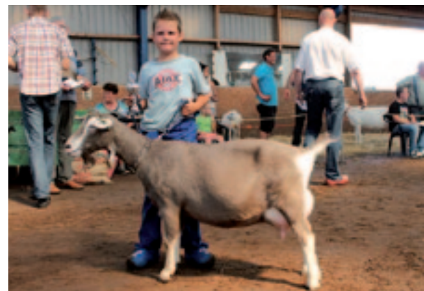
Kina 7 van J. Nauta kreeg de beker voor dagkampioen uier.