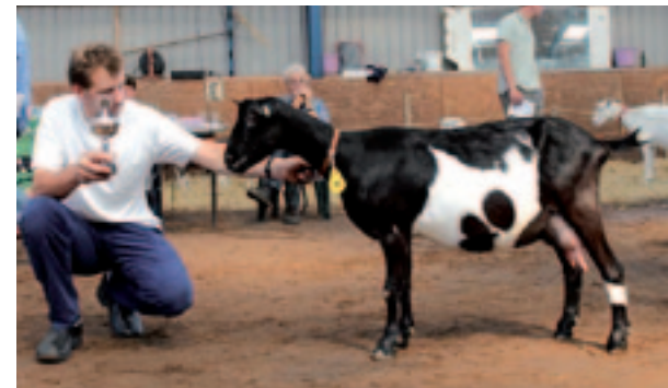
Esther 118 van Stal Domsta werd kampioen bij de Bonte melkgeiten.