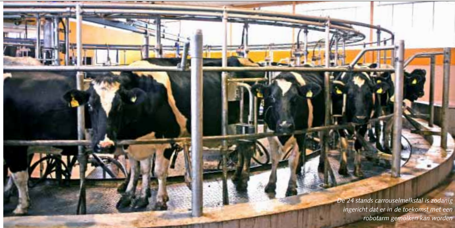
De 24 stands carrouselmelkstal is zodanig ingericht dat er in de toekomst met een robotarm gemolken kan worden