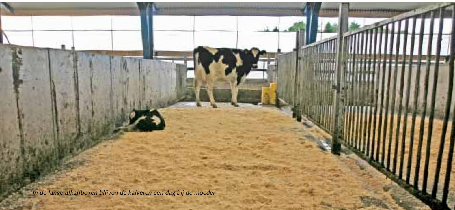
In de lange afkalfboxen blijven de kalveren een dag bij de moeder