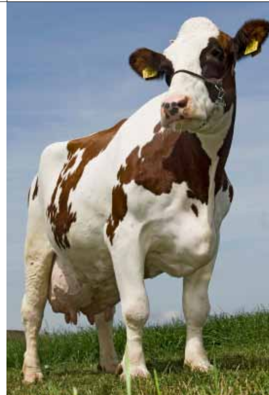
De excellente Martha voert al voor de derde keer in haar leven de toplist van de mrij-koeien aan

De rode Caudumer Hinke 111 is niet de enige Hinke in de toplist, haar zwarte stalgenote Caudumer Hinke 51 vergezelt haar