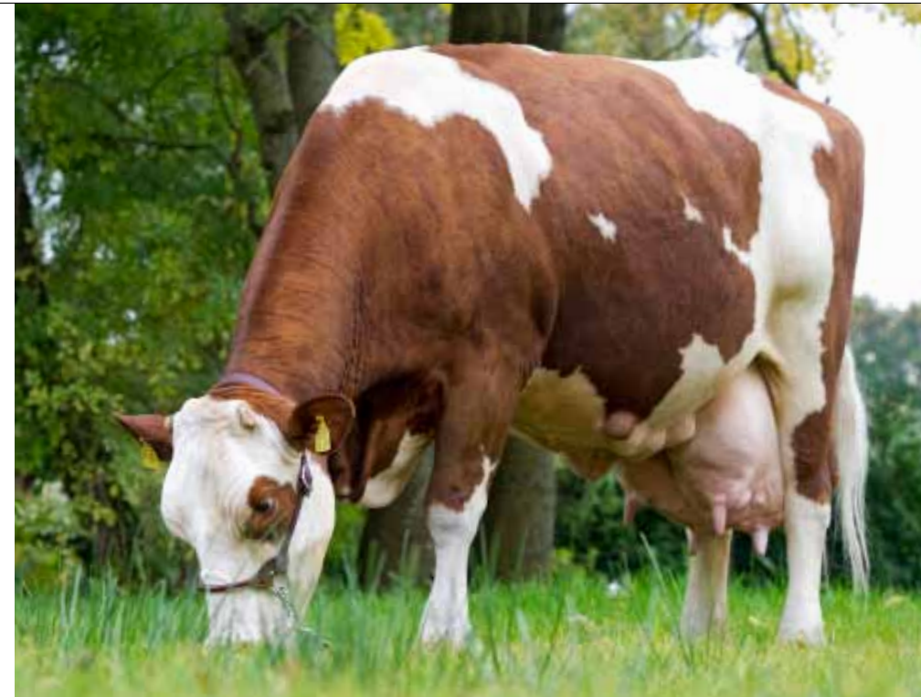
Fleckviehkoel Sonne behaalde het hoogste eijr in Nederland

Op basis van het economisch jaarresultaat komt Linda afgelopen boekjaar als beste koe naar voren bij de Vlaamse roodbonten. Linda sloot haar tweede lactatie af met een productie van 12.085 kg melk met 4,97% vet en 3,82% eiwit in 314 dagen, goed voor een eijr van 3931 euro.