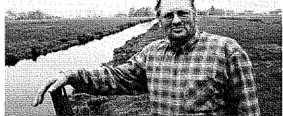
Voorzitter Boer van de vereniging DWLK