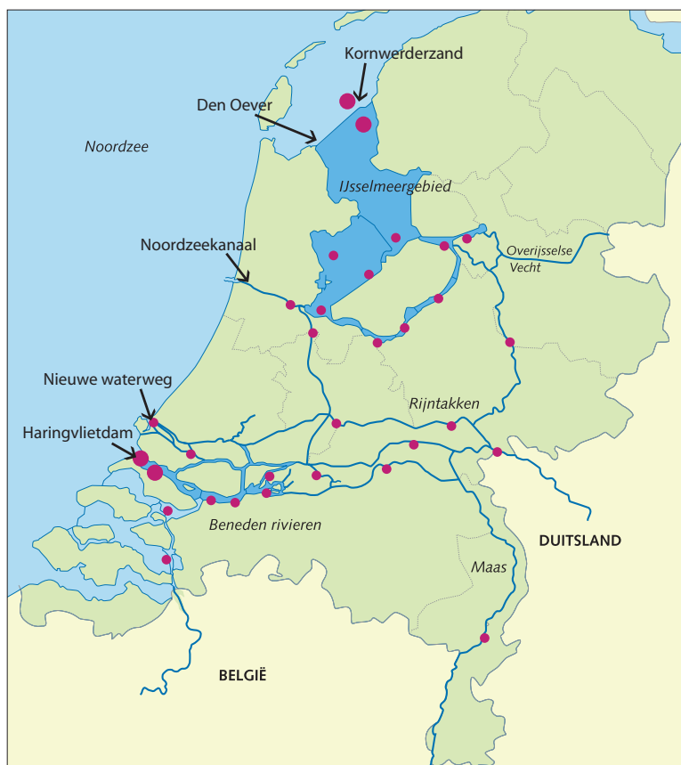
Figuur 1: De zogenaamde 'passieve' vismonitoring met fuiken vindt plaats op dertig locaties verspreid over de Nederlandse rijkswateren. In samenwerking met beroepsvissers worden van april tot en met november op iedere locatie de vangsten van vier fuiken geregistreerd (Winter et al., 2004).

De grote rivieren zijn de blauwe aders van het landschap die oorspronkelijk een grote dynamiek en soortenrijkdom kenden. Ze herbergden een grote variëteit aan habitats en verbonden de bovenlopen van beken met de estuaria en de zee. In de afgelopen eeuwen heeft de mens de Nederlandse rivieren sterk veranderd. Voor de veilige afvoer van water, ijs en sediment, de scheepvaart en de landbouw zijn zomer- en winterdijken, kribben, dammen en stuwen aangelegd. Het karakter van de rivieren is daardoor ingrijpend gewijzigd. Samen met de sterke verontreiniging en zware overbevissing hebben deze ingrepen geleid tot het verdwijnen van veel typische rivierissoorten. Sinds de jaren tachtig van de vorige eeuw is veel inspanning gepleegd om de rivieren te herstellen. Inmiddels is de waterkwaliteit flink verbeterd, zijn barrières van vistrappen voorzien en worden nevengeulen in de uiterwaarden aangelegd. Plannen voor de toekomst voorzien in meer 'ruimte voor de rivieren', waarbij ecologisch herstel hand in hand kan gaan met het handhaven van de bescherming tegen hoogwater.