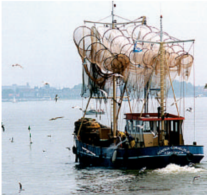
Visserschip met drogende fuiken. Op dertig locaties worden bijvangsten in vier fuiken geregistreerd om een beeld te krijgen van de minder algemene en zeldzame vissoorten