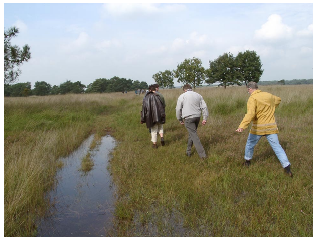
Het team Natuurbalans 2001 verkent de Kalmthoutse Heide

maken. De teamleden vinden ook dat de logistieke structuur rondom de Natuurbalans verbeterd kan worden. Een introductiefolder met wetenswaardigheden voor de productie van een Natuurbalans geeft met name aan nieuwe projectleden een steun in de rug. Daarnaast is een reëler capaciteitsplanning voor logistieke ondersteuning van belang.