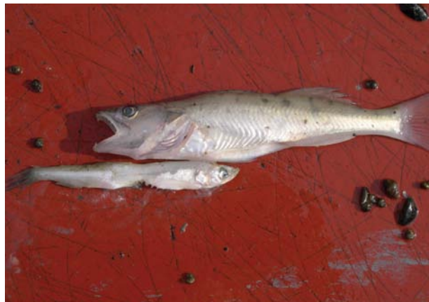
Spiering vormt de schakel tussen plankton en predatoren zoals snoekbaars.

grens rond het limit reference point, dan wordt de visserij een week later opengesteld – zoals in 2006 het geval was. Hierdoor kan een relatief groter deel van de vissen paaïen en zo de toekomstige spieringstand veiligstellen. De visserij op spiering vindt plaats in het voorjaar en duurt ongeveer drie weken. Deze komt overeen met de periode dat de volwassen spiering massaal langs de randen van het Markermeer en IJsselmeer samschoolt om te paaïen. Met fuiken wordt dan vrijwel uitsluitend spiering gevangen, zonder bijvangst. De paaïperiode valt meestal eind februari of begin maart, afhankelijk van het moment dat de watertemperatuur gaat oplopen. Is er in een jaar voldoende spiering voor de visserij, dan wordt de start van de visperiode bepaald door een proefvisserij met spieringfuiken die door enkele beroepsvissers wordt uitgevoerd. Daarbij wordt een ondergrens van een twintig kg spiering per fuikstel (tien kg per fuik; spieringfuiken staan paarsgewijs tegenover elkaar) voldoende geacht om het visseizoen te openen. In de eerste week worden vooral spieringen gevangen die nog moeten paaïen, in de laatste week doorgaans meer spieringen die al hebben gepaaïd.