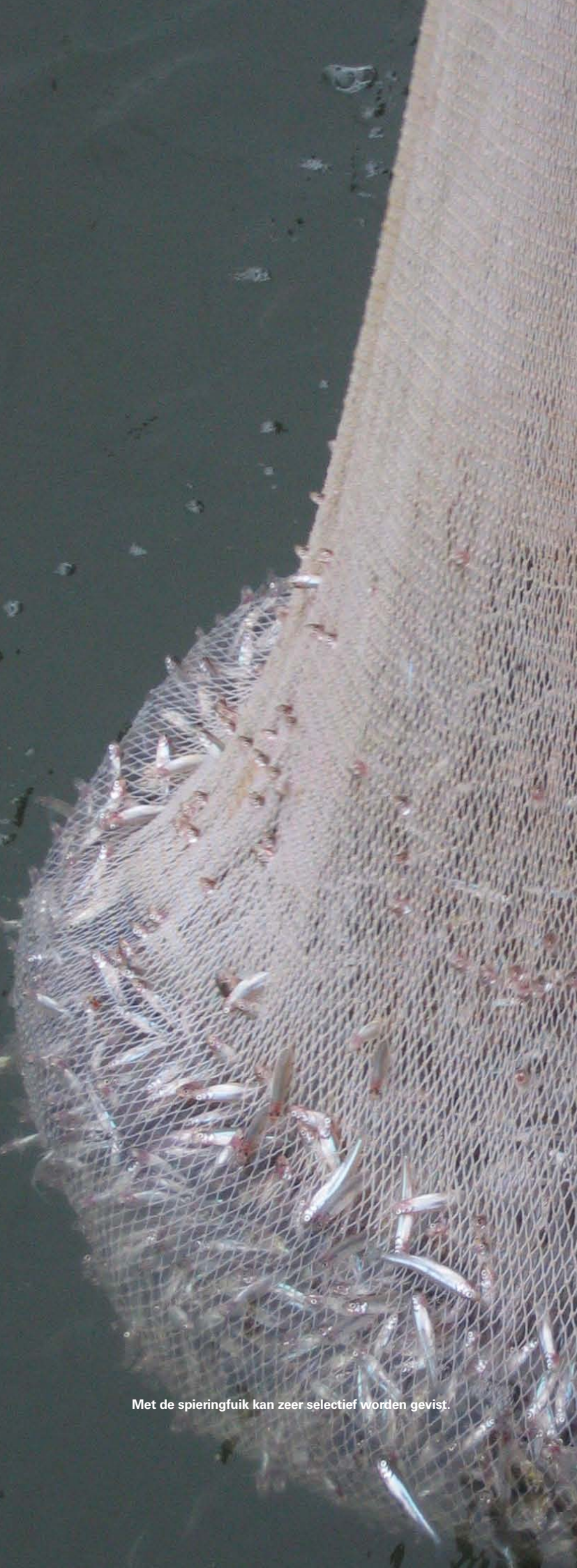
Met de spieringfuij kan zeer selectief worden gevestig.

oppervlaktewater zijn de afgelopen jaren afgenomen. Mogelijk beperkt dit gebrek aan met name fosfaat de algengroei in het voorjaar, en daarmee de aanwas van zoöplankton zoals watervlooien. Daarmee zou het voedsel voor jonge spiering minder talrijk zijn geworden. Toch is deze hypothese over de relatie tussen meststoffen, algen en zoöplankton niet zo hard. Spiering komt namelijk ook talrijk voor in meren met veel minder meststoffen en algen in bijvoorbeeld Scandinavië en Rusland.