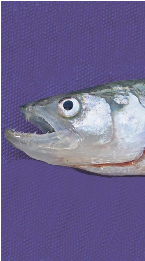
Spiering is een veelvoorkomende, maar toch vrij onbekende soort.

Het spieringbestand daalt al twee decennia gestaag. De spiering is geen gewaardeerde consumptievis, maar als schakel tussen plankton en predatoren wel een belangrijk onderdeel in het voedselweb. Mogelijke oorzaken die een rol spelen in de teruggang van de spiering zijn de temperatuurstijging en het helder worden van wateren. Nader onderzoek moet uitwijzen welke maatregelen deze vissoort er weer bovenop kunnen helpen.