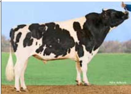
SLOTBOOMS PILOT (MASCOL X JOCKO)