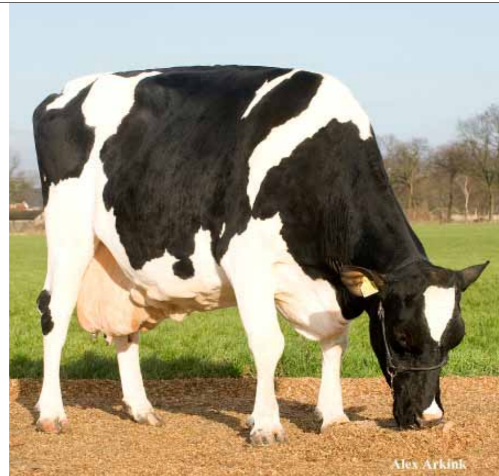
Pilots moeder Geertje 358 (v. Jocko), gefotografeerd op ruim negenjarige leeftijd