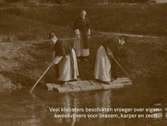
Veel kloosters beschikten vroeger over eigen kweekvijvers voor brasem, karper en zeelt.